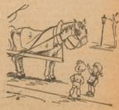
Was hat's das Pferd an de Drogen? Menich, der Schiffe doch, der haben sie verdrängt!

Das britische U-Boot 'Swordfish' ist verloren. Das Boot hatte eine Wasserdrift von 600 Tonnen und eine Besatzung von 40 Mann. Der 'Swordfish' in Londoner Hafen.