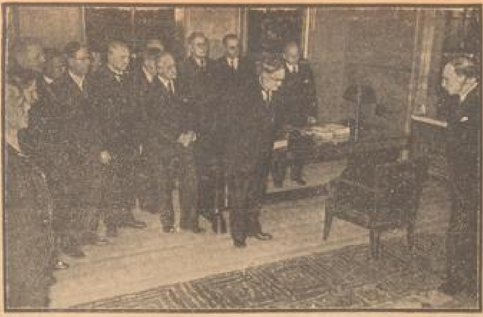
Risto Ryti — Finnlands neuer Staatspräsident

Nach der Wahl wird vom finnischen Reichstagspräsidenten Goffin die Bescheinigung der Staatsregierung ausgereicht.