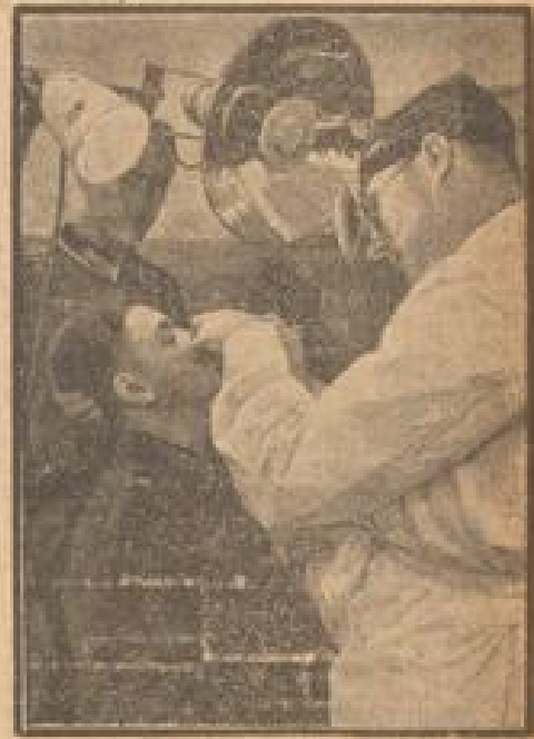
Werkliche Heilung bei der Wehrmacht

Wielche Handmaschinen lösen die Wirkung auf diesem englischen Kreuzer, der in der Nähe von Portland bombardiert wurde, erkennen. Ein anderer Bombeneinschlag in der Nähe des Kreuzers bewirkte, daß der Angriff noch nicht beendet ist. (Wissenschaftl. Presb., Sonder-Multispektr.)