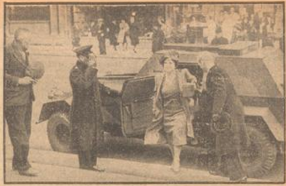
Die englische Königin fährt im Panzerwagen

Nach der Wahl wird vom finnischen Reichstagspräsidenten Goffin die Bescheinigung der Staatsregierung ausgereicht.