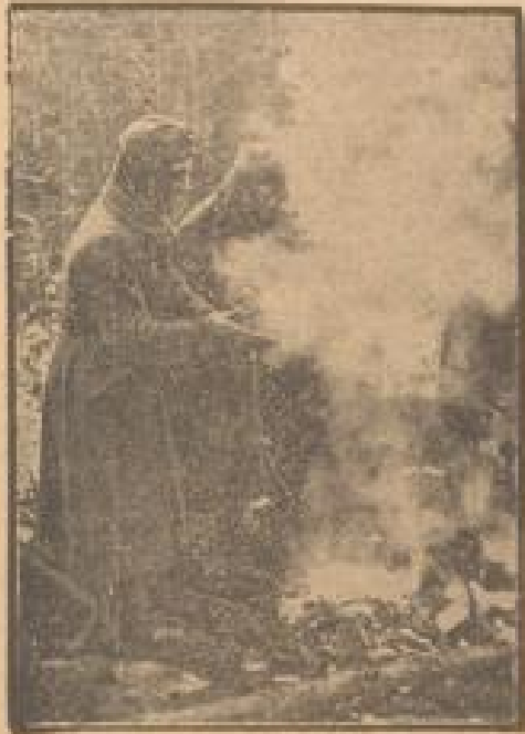
Bei einer Baufirma im Ofen

Bei Fahrten während des Sommers wurde für die Queen ein Spezialwagen gebaut, der fast gepanzert ist. — Hier sieht man die Königin Elisabeth beim Verlassen ihres Panzerwagens.