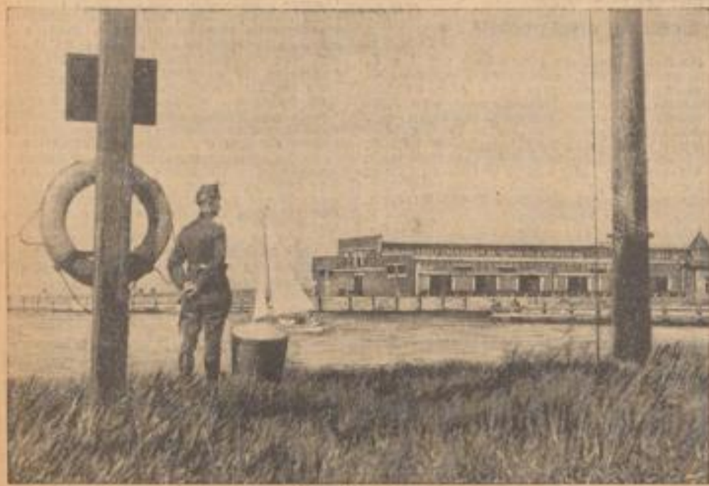
Polnisches Munitionslager in Danzig Das Bild zeigt auf der rechten Seite vor der Danziger Hafenfront ein polnisches Munitionslager, dessen Auflösung der Danziger Gewerkschaften fordernd gefordert hat.