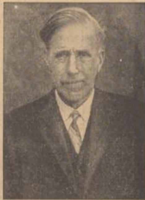
Beiteiro zu 30 Jahren Gefängnis verurteilt Der spanische Sozialistenführer und ehemalige Vizepräsident Julian Beiteiro, der am Ende des spanischen Bürgerkriegs dem sogenannten Madrider Volkskomitee angehörte, ist durch ein Kriegsverbrechen zu 30 Jahren Gefängnis verurteilt worden.