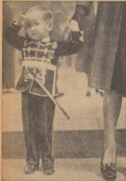
Diesen kleinen Soldaten Wie man im Gefolge eines Kinderspiels in Danzig, der Produktion ist Angehöriger eines englischen Infanterieregiments. (Kfollstedt Vrech, Jander-M.)