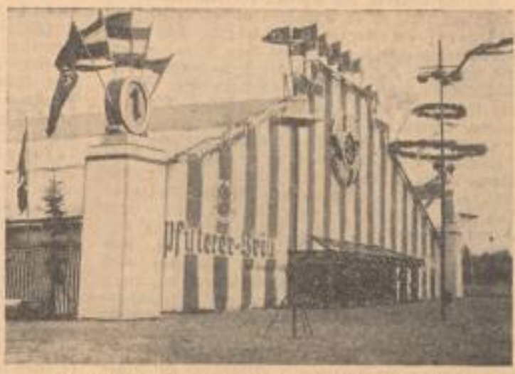
Die Fassade des Adolph-Meeres im Flaggenschmuck

Das Mannheimer Sommerfest wurde bisher von weit über 150 000 Personen besucht. Das ist ein Erfolg, der die Erwartungen übertrifft hat. Mit jedem Tag wachsen die Besucherzahlen. Es spricht sich herum, daß sich der Gang nach dem Adolf-Hitler-Meer lohnt. Es steht außer Zweifel, daß die letzten Tage des Festes, vor allem der Samstag und Sonntag, einen ganz besonders starken Andrang bringen werden, zumal so für übermorgen abends das große abschließende Feuerwerk bevorsteht; es wird etwa um 22 Uhr beginnen.