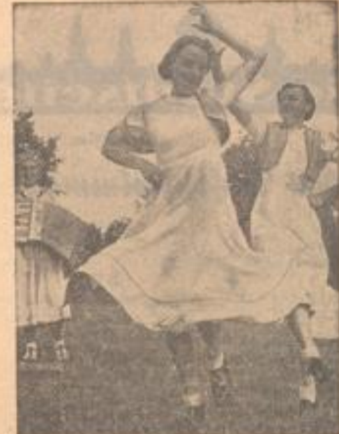
Die Mädel, die sich zur Zeit in den schönen Baden-Heimstätten...