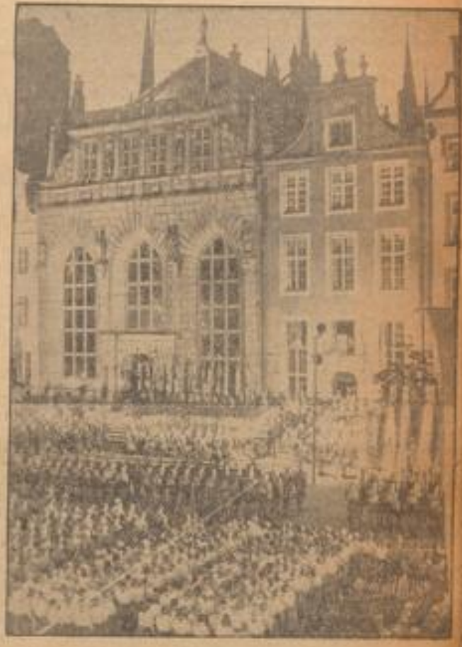
In Danzig begann der Adolf-Hitler-Marsch der SA

Sämtliche Jungen der Hitler-Jugend des Reiches Berlin haben die Möglichkeit, in einem Sommerlager bei Potsdam (Mark) sich für den Besuch des Segelflughafens A zu bewerben. — Hier gibt der Fliegerführer seinem Schüler Anweisung über Haltung und die Starttechnik.