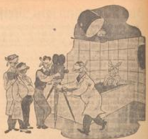
Legend im Juweliersicht. Am Bildsticker: „Ich finde, Sie stellt sich heute wieder einmal sehr jämmerlich an.“ Zeichnung von H. Bonett (Schweiz)