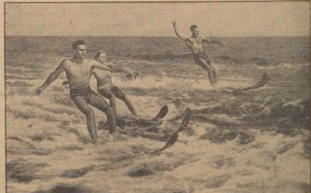
Angenehme Beschäftigung bei 25 Grad im Schatten