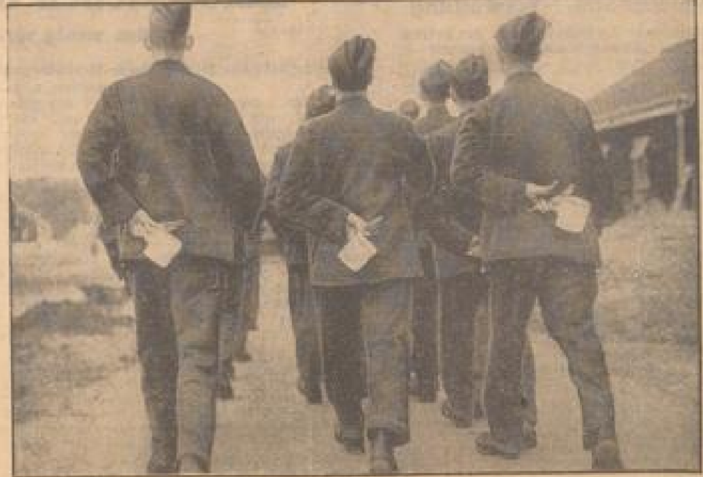
Englands junge Rekruten