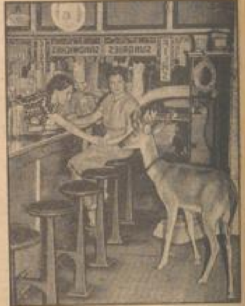
Aus einem Waldbrand gerettet