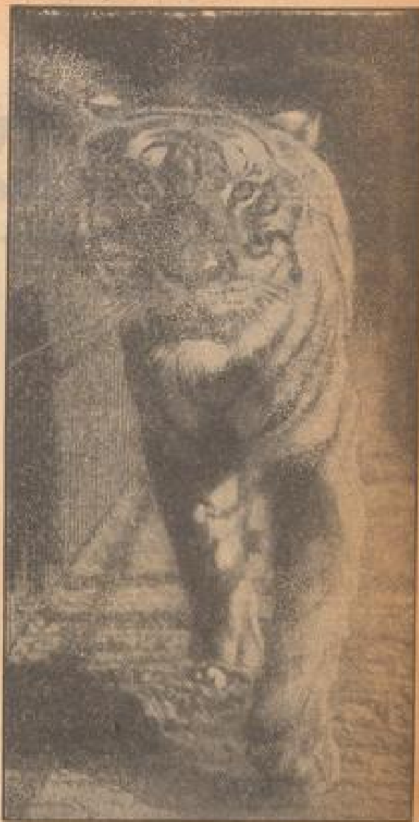
Grundauslauf des Tigers... Mannheim, 1. August.

„Wilen“ gegen Panik!... Mannheim, 1. August.