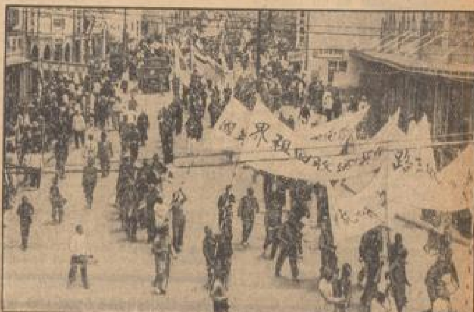
Die massenhafte Demonstration der unter japanischer Kontrolle stehenden Gebiete beweist durch eine einseitige Teilnahme, daß in der Haltung Englands gegenüber dem anti-englischen Kundgebung in Tientsin, bei der die mangelhaften Verhandlungen der Währungsfrage im Vordergrund stehen, eine gewisse Unterstützung besteht.

Die japanische Einfuhr nach Nordchina betrug im Rechnungsjahr 1938 rund 210 Millionen Dollar, was eine Verdoppelung gegenüber dem Vorjahr bedeutet. Die nordchinesische Einfuhr nach Japan belief sich auf 154 Millionen Dollar; im Jahre 1937 war sie etwa gleich hoch.