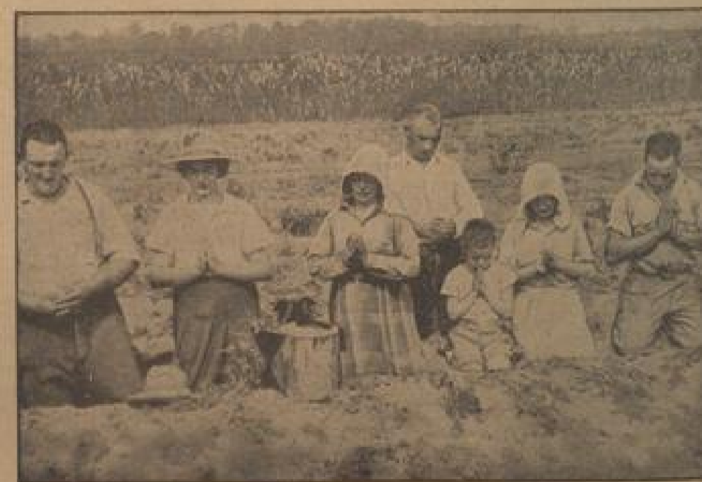
Die beten um Regen... (Presse-Kommunikation, Landes-Verwaltung)