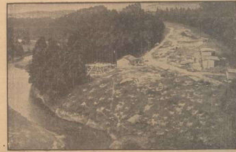
Die erste Autobahn im Reichsland... (Presse-Kommunikation, Landes-Verwaltung)