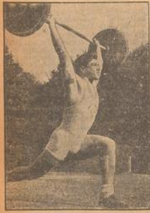
Der Mann, der Weltrekord reißt

Der große Deu'er-Merle hat sich in Berlin... (Text continues with details of the athlete's performance and the event's significance.)