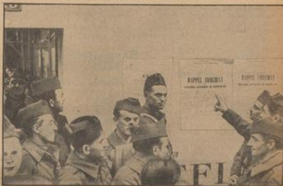
Frankreich ruft seine Reservisten ein. Überall sieht man die entsprechenden Plakate.