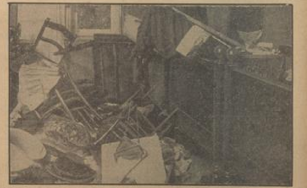
Wo polnische Verführungsmittel sich anstobte

Ein Bild von der Ankunft des hohen Schiffs der Kaiserlichen Marine im Danziger Ost-Land Schiffsamt wird von den Oberabteilungen „Albert Höcker“ und „Tanzig“ beobachtet.