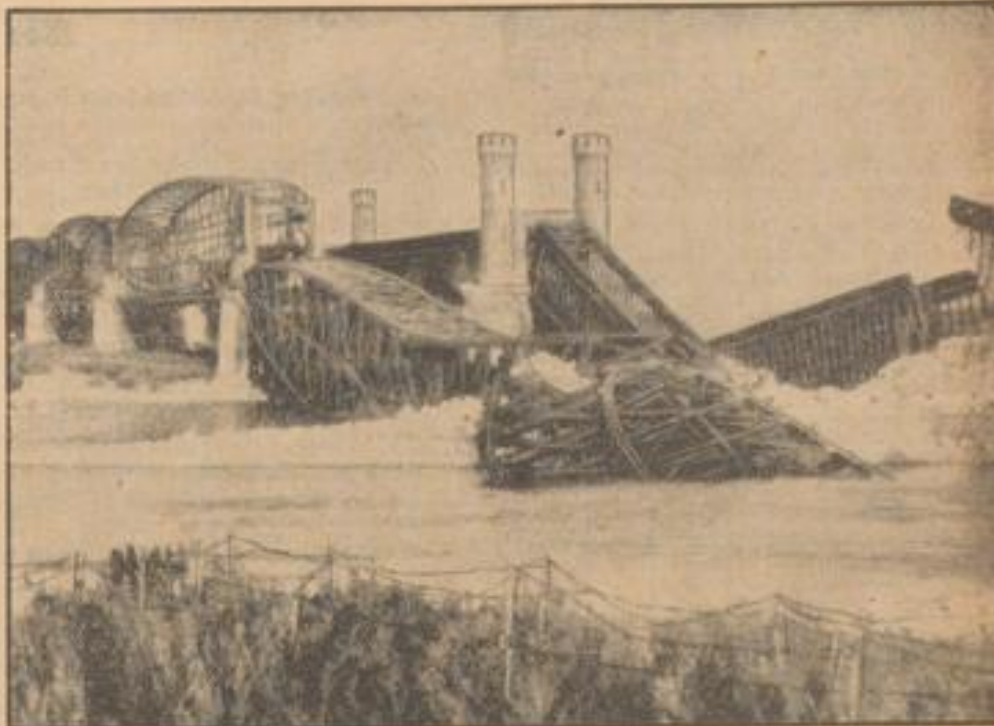
Wechselbrücke flog in die Luft Vor dem Wagnis trennten die Polen die Eisenbahnbrücke in Dirschau.