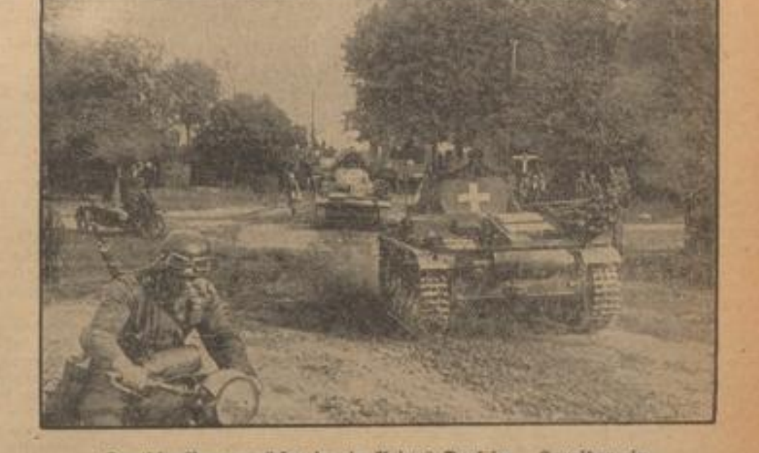
Deutsche Panzer rücken in ein kleines Dorf im Korridor ein

für ihr heiliges Recht entscheidend ist. Auch die noch wehrfähige Jugend, bei unserer Pimpfen anwesend, hat die Möglichkeit und Pflicht, durch ihren Dienst in der Hitler-Jugend auf ihre Weise in diesen Krieg mitzukämpfen. Unsere Jungs- und Mädels sind bereit, sich jederzeit durch gewissenhafte Durchführung der ihnen übertragenen Aufgaben dem Vaterland zu dienen. Ich werde in Kürze den Einlaß der einzelnen Jahrgänge der deutschen Jugend durch besondere Anordnungen erteilen. Galtet Euch bereit, der Führer braucht Euch alle!“