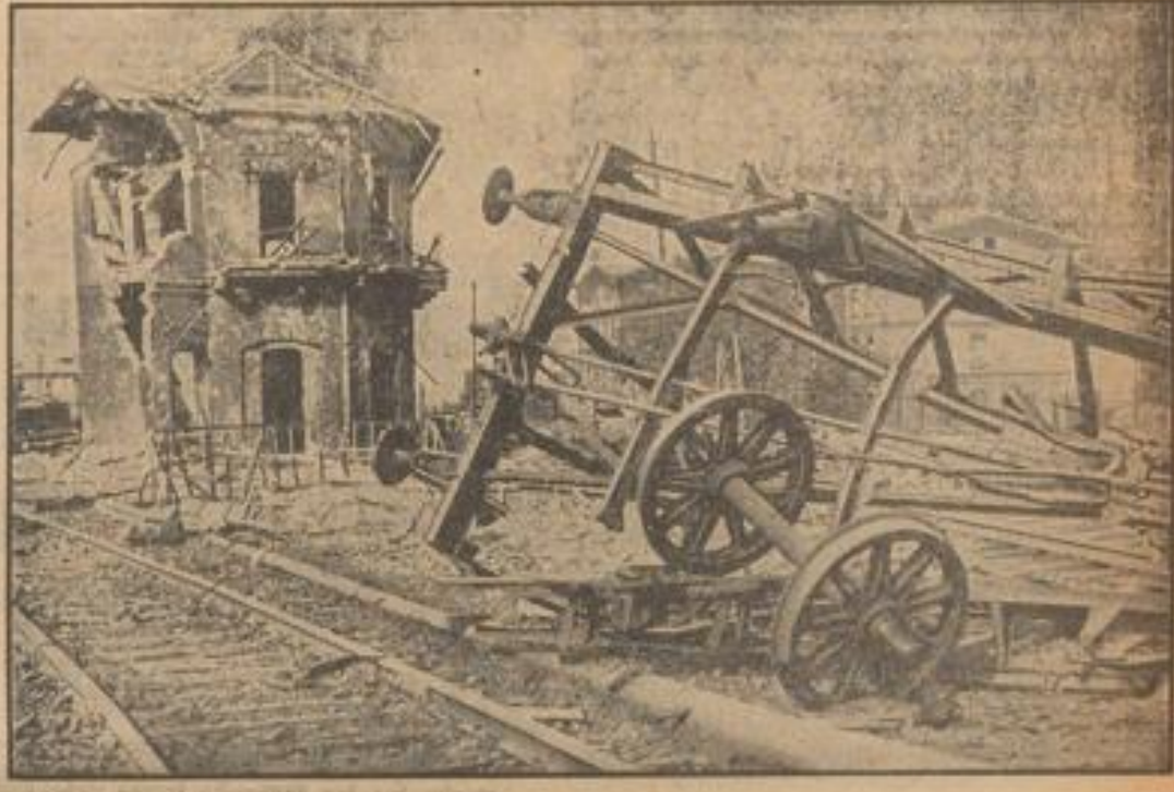
Die ersten Kriegsverwüstungen In Karnowitz wurden von den Polen sämtliche Wohnhäuser zerstört. Mitternachts in die Stadt von der deutschen Truppe besetzt worden.