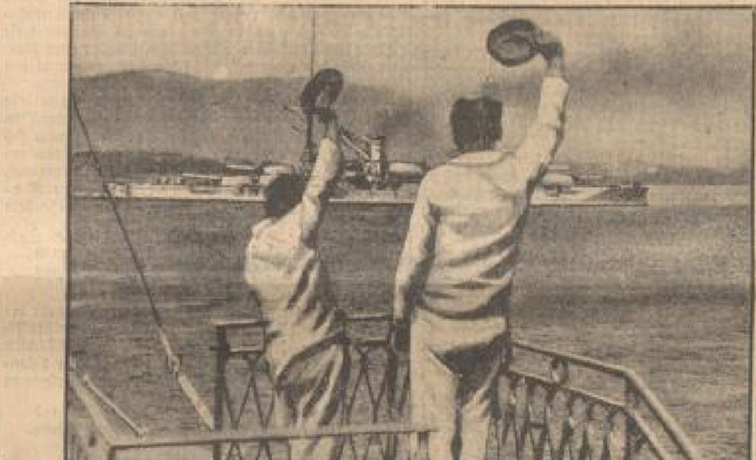
Das erste Geschwader der französischen Flotte ist von Toulon in Übungen an der Südküste und in der Nähe von Karthago ausgelaufen. Auf unserem Bild verläßt das Flaggschiff 'Doreigne' den ...