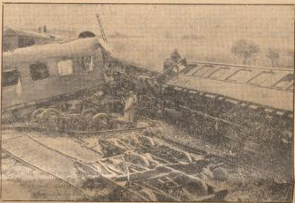
Wenn ein Schnellzug entgleist. Bei der Station Charlottenburg in der Nähe von Stargardt, wie schon berichtet, der Schnellzug nach Vöckla. Die Lokomotive und mehrere Waggons hielten um und wurden zertrümmert. Hierbei wurden zwei Personen getötet und 10 schwer verletzt.

Nach mehreren Stunden aufgehoben. Er ging zu dem Fahrrad und sah sich die dort stehenden Kleidungsstücke an. Er sah sehr leicht zu erkennen, daß es er gewesen war, den man vermißt hatte und daß er doch mit, ohne es zu wissen, sich selbst gefundene hatte.