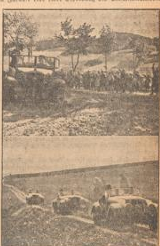
Ober: Ein Auto-Motor-Geschwader der Wehrmacht. Unten: Die 3-Tage-Mittelgebirgsfahrt auf dem Mittelgebirge.

Die Teilnehmer der Mittelgebirgsfahrt sind sehr stolz auf ihre Leistung. Die Teilnehmer haben sich mit den Schwierigkeiten der Mittelgebirgsfahrt auseinandergesetzt und sind überzeugt, dass die Mittelgebirgsfahrt eine hervorragende Gelegenheit bietet, die Olympischen Spiele 1940 aufzunehmen.