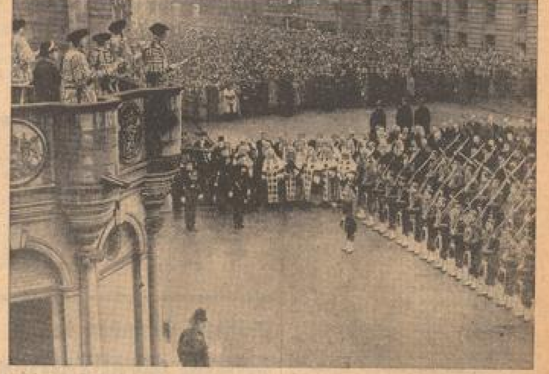
In den Straßen Edinburghs in Schottland erfolgt die Königsproklamation ebenfalls in allerbekanntester Weise. Sir Francis Grant spricht.

Wahrscheinlich sei der Vorschlag, daß jede der beiden Parteien das von ihr bei der Aufteilung der Grenzgebiete besetzte Gebiet behalten solle. Das Blatt hält es jedoch keineswegs für sicher, daß die beiden kriegführenden Parteien in Spanien einer Vermittlungsaktion zustimmen werden. In Belgierungsstadien wurden die britische und die französische Regierung ihre ganze Aufmerksamkeit auf eine einmündige Durchführung der Richtlinienmischungsabkommen richtend.