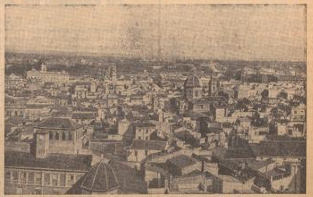
Zum erstenmal hat der Stab der spanischen Republikaner, das rote Valencia, Ziel vertriebener Anarchisten der nationalen spanischen Streitkräfte. (Rechts: M.)