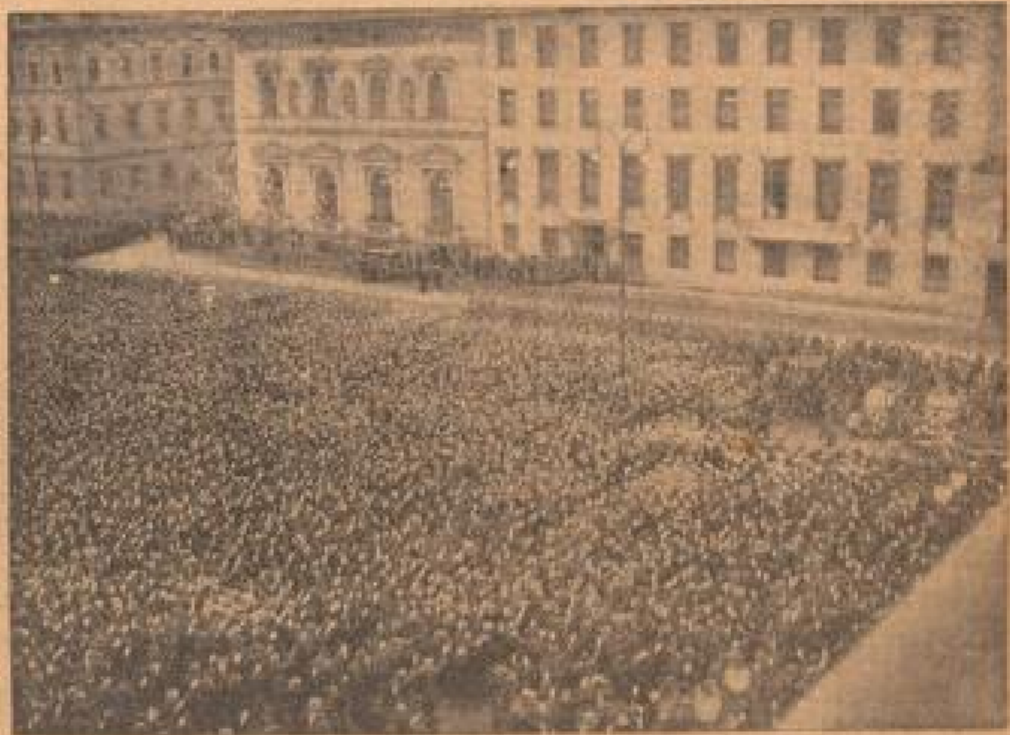
Ansicht der Kundgebung der Eisenbahner in der Reichshalle am 3. Februar 1937.