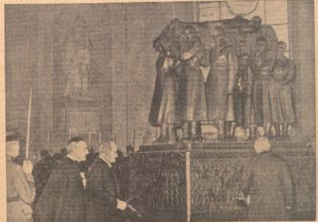
Wachposten hoch an der Seite Napoleons beiseite

Die Leiche des vor acht Jahren verstorbenen Marschalls Hoch wurde unter höchsten militärischen und kirchlichen Ehren aus dem Grabschloß des Invalidenfriedhofs, wo sie bisher provisorisch beigesetzt war, in die Krypta des Invalidenfriedhofs überführt und dort in einem von dem Kaiser Napoleon selbst gestifteten prächtigen Grabsteine an der Seite Napoleons I. zur ewigen Ruhe beigesetzt. — (Schreibk. 24.)