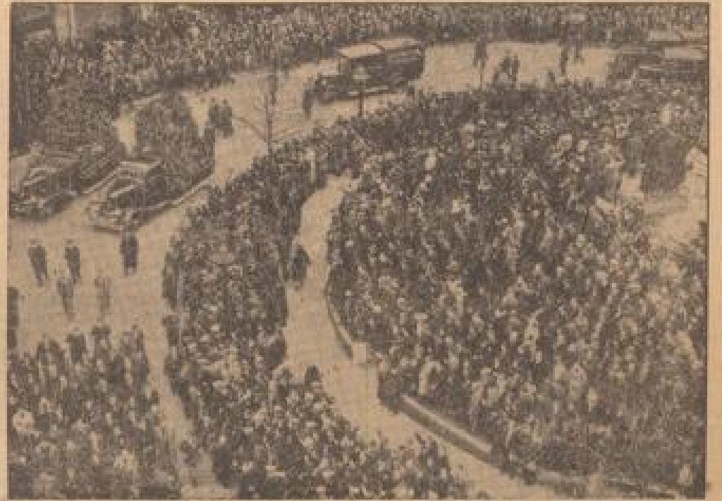
In Paris wurden die Entwürfe der Anlagen von Ellichy unter der Bezeichnung der ...