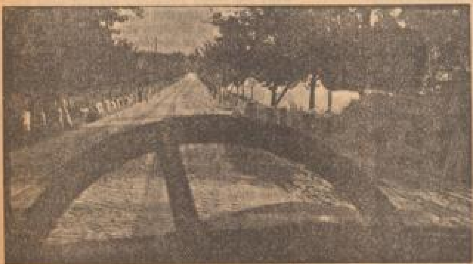
Erster Blick in den Wald.

Diese Reparaturen, rechtzeitig durchgeführt, verhindern teure hohen Kosten, sondern erst dann, wenn der Kraftfahrer auf die natürliche Kaufung keine Rücksicht nimmt und munter drauf-