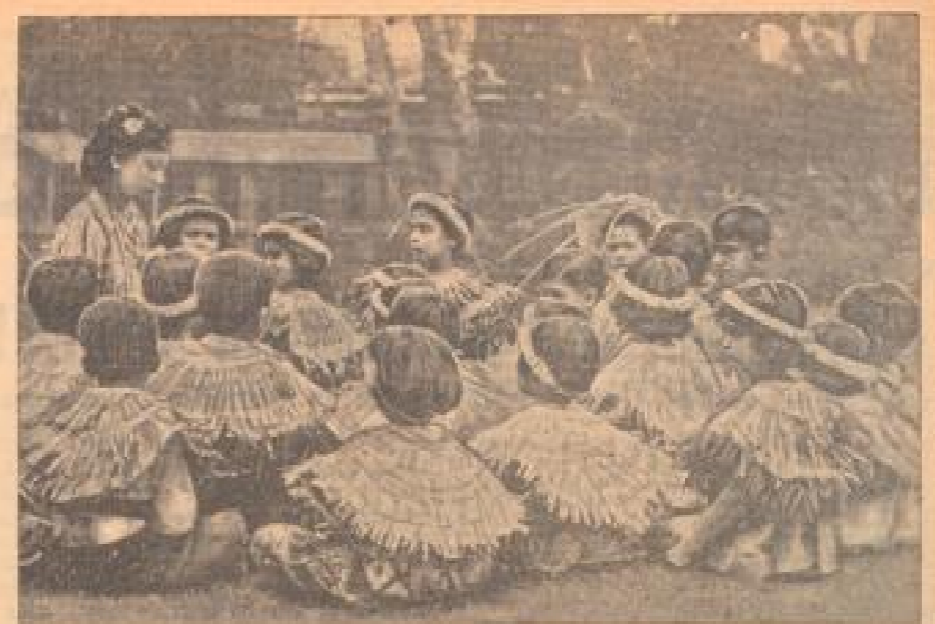
Kleines Volk in Honolulu! Die Kinderpartei unter freiem Himmel wird hier von einer kanakischen Vokalistin dirigiert. Die in der Mitte ihre Ausbildung empfangend.

Dieser Tage wurde wieder ein Fall aus Konstantinopel gemeldet, der sich gegen den Verbot des "Vollständigen" verhielt. Es handelte sich um eine türkische Mutter, die es nicht lassen konnte, ihrer kleinen Tochter die Haare zu waschen, d. h. sie durch Handbäder im warmen Wasser zu verwickeln. Diese Krampffälle, eine das überflüssige Schönheitsideal, sind im modernsten Gebrauche wie manche andere alte, gesundheitsgefährdende Ueberlieferungen verboten worden. Verurteilungen gegen die Verordnungen werden schwer bestraft.