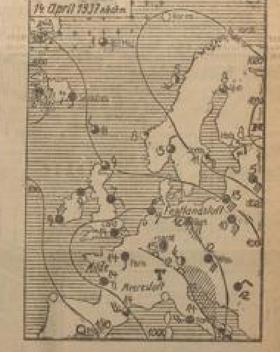
Zeichenerklärung zur Wetterkarte