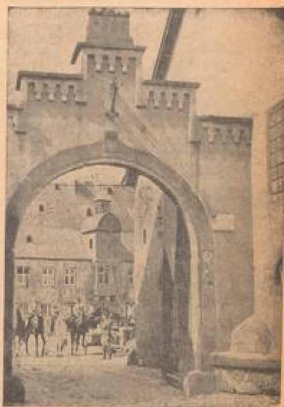
Fertig zum Ausritt

Nun, da gibt es allerhand Arbeit für die jungen Schülerinnen, die mit Fuß und Pöde bei der Sache sind. Er beginnt um 10 Uhr morgens, faszolagen in dieser Jahreszeit nach dem ersten Gabenstreich. Da heißt es raus aus den Betten, rein in die Stallluft, und dann hinunter zu den Pferden. Denn nicht mit dem eleganten Sit im Sattel und mit einem leid aussehenden Reitdres ist es getan, sondern zur wirk- lich gut ausgebildeten Reiterin gehört auch das sie mit ihrem Pferd in jeder Beziehung vertraut ist. Alle Anfang ist daher das Putzen der Tiere. Mit Striegel und Kardische heißt es, unten im Stall das Fell der sehr manierten Wäule folgende Bear-