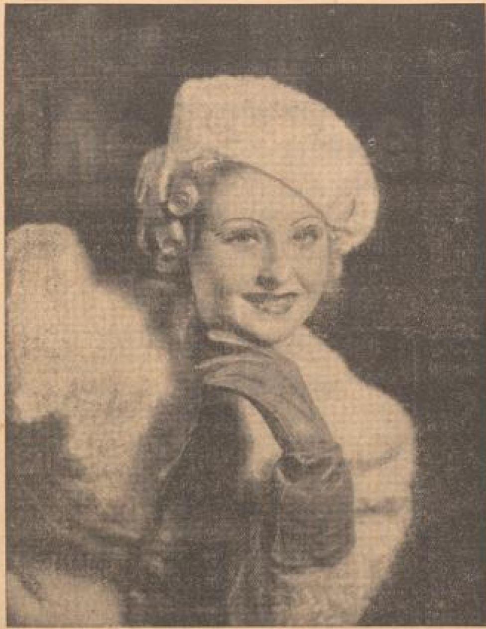
Die beliebte Künstlerin in ihrer neuen Rolle im Ufa-Flm „Sieben Ohreigen“