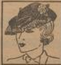
Frische Kleider, Form „Fischer“