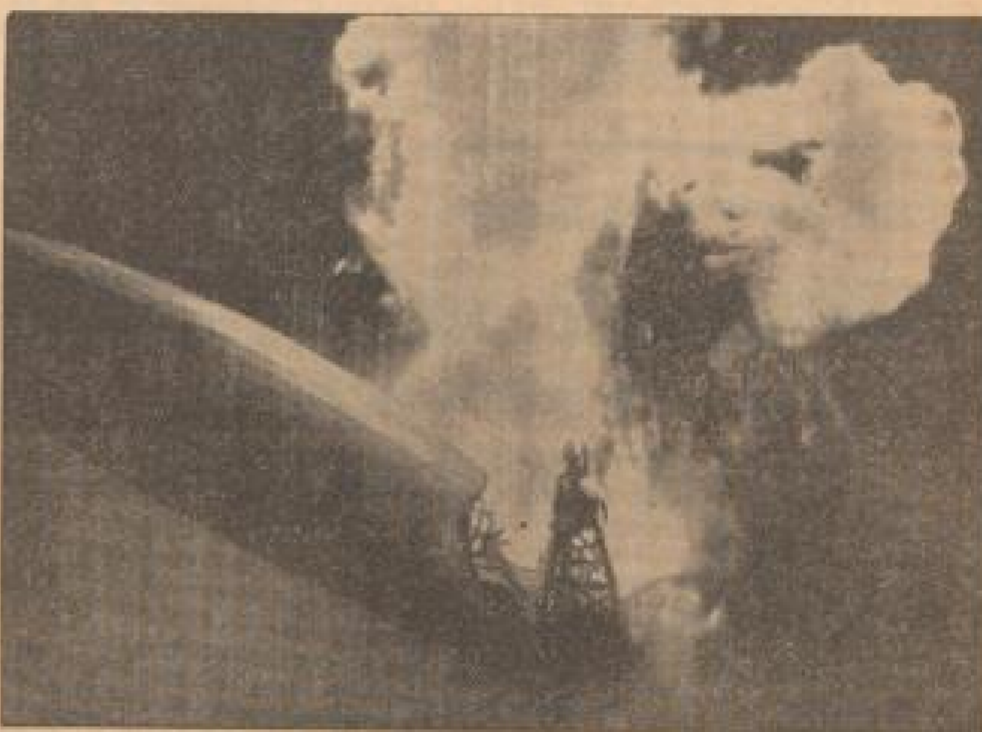
Das Luftschiff „Hindenburg“ im Augenblick der Explosion in Ostpreußen.