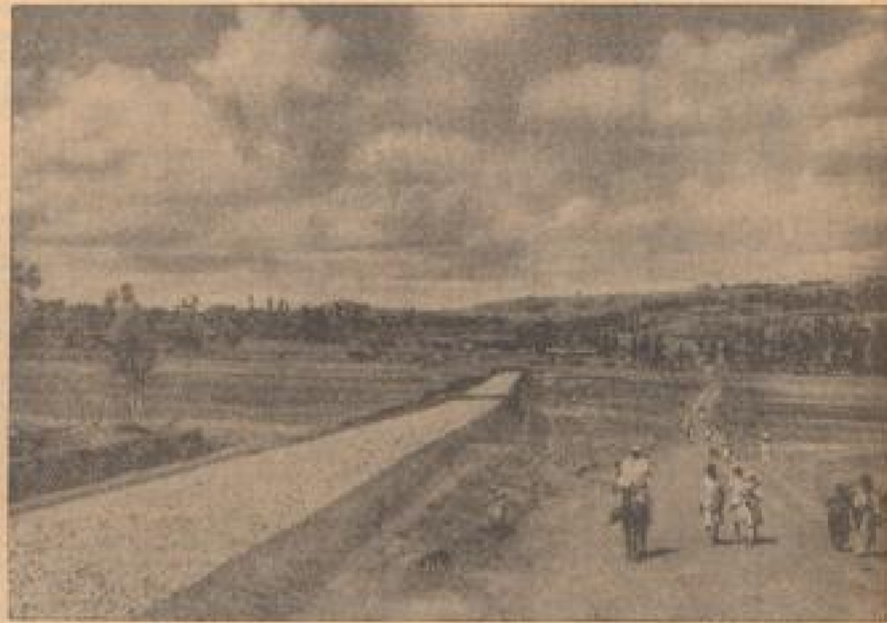
Im unendlichen Abessinien erstreckt Italien in Abyssinien ein Netz ganz neuer und zum Teil wichtiger Straßen. Im Vordergrund sind die Arbeiter zu sehen, die an der Fertigstellung der Straße arbeiten. Die Straße führt durch eine weite, offene Landschaft mit vereinzelten Bäumen und Büschen.