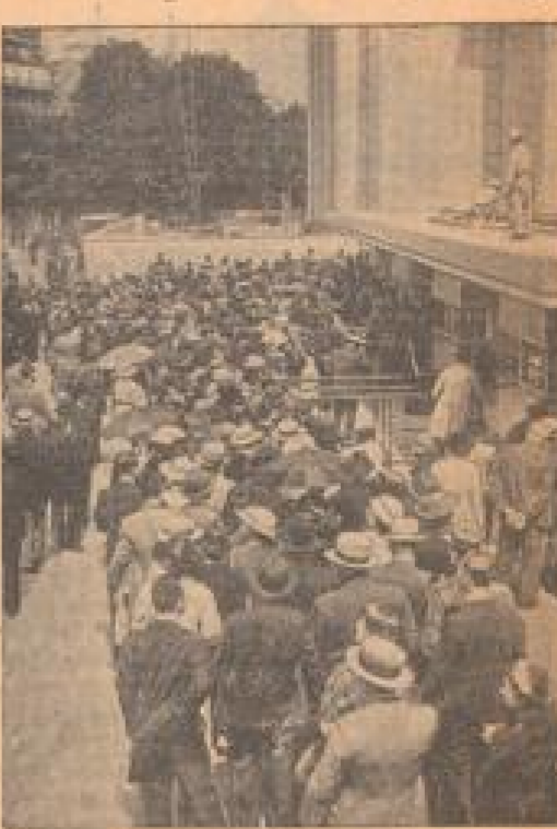
Während noch an der Verfertigung einiger Kunst-