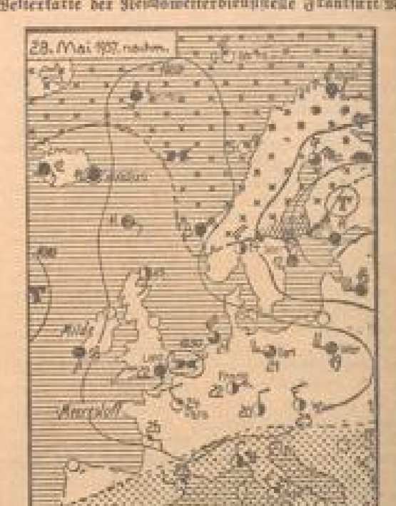
Wetterbericht der Reichswetterdienststelle Frankfurt a. M.