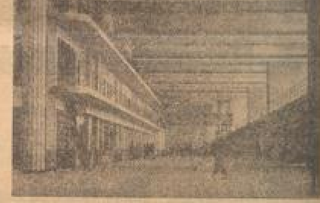
Die neue Flugplatzanlage in Le Bourget. Die Anlage ist ein Werk der Moderne.