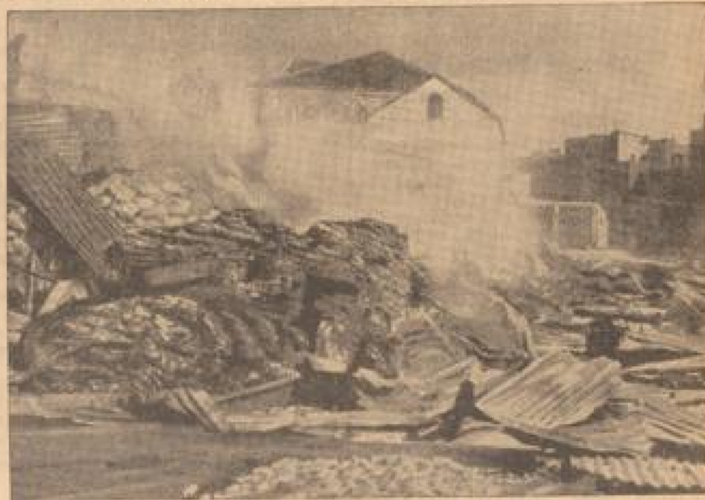
Wohnhäuser arabischer Nationalisten, die von den Engländern in die Luft gesprengt wurden.

Beobachtungen lediglich um Uebungen inner- und britischer Flottenverbände gehandelt habe.