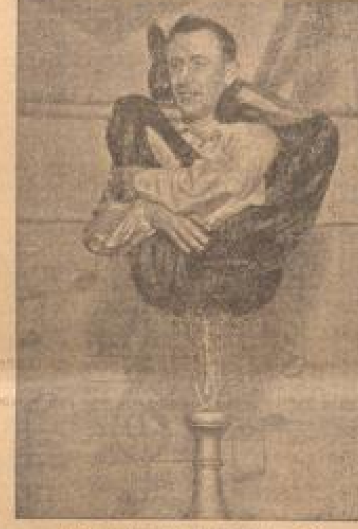
Nicht ganz einfache Angelegenheit! Häufig eine große Sache, der Verbrecher wird sich nicht wehren. Ein Mann, der die Polizei nicht zu fürchten hat, ist ein Mann, der die Polizei nicht zu fürchten hat.