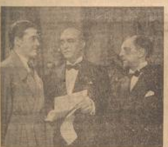
Die Szene aus dem Film 'Brand in London', der ab heute in Mannheim gezeigt wird.

Am einer mysteriösen zwingigen Nacht, die auf dem Atlantik kostbarsten Beilen von der Küste Irlands entfernt dahinstreift, bricht die Kapitan eines englischen Dampfers, der dieser Tage im Ozean von Norden einlief.