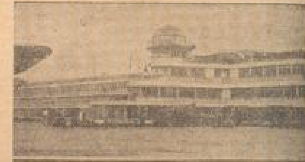
Die neue Flugplatzanlage in Le Bourget. Die Anlage ist ein Werk der Moderne.