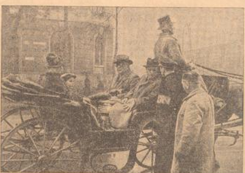
Was Man wollte in München. Der auf einer Teufelskur durch München. Hier sehen wir ihn mit seiner Familie auf der Fahrt durch die Stadt.