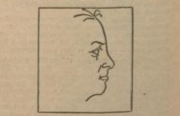
Abb. 1: Ingeformtes Profil

Die Profillinien sind ein Zeichen für einen Menschen, der sich auf seine Sinne verlassen kann. Die fliehende Stirn ist ein Zeichen für einen Menschen, der sich nicht auf seine Sinne verlassen kann. Die hellen Stirn ist ein Zeichen für einen Menschen, der sich auf seine Sinne verlassen kann.