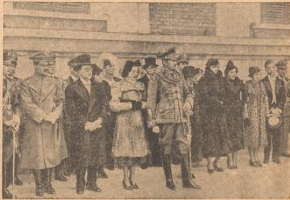
Festtage in der albanischen Hauptstadt

Königin feierte die Wiederkehr des Tages, an dem vor 75 Jahren die Unabhängigkeit erlangt wurde, mit großen Festen. — In der Hauptstadt Tirana fand vor dem König der Königin, Königin Joan (rechts), eine große Parade statt. (Schreib, Jänner-31.)