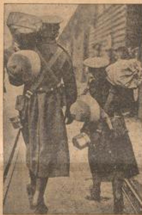
Gemeinsam nach Indien

Königin feierte die Wiederkehr des Tages, an dem vor 75 Jahren die Unabhängigkeit erlangt wurde, mit großen Festen. — In der Hauptstadt Tirana fand vor dem König der Königin, Königin Joan (rechts), eine große Parade statt. (Schreib, Jänner-31.)