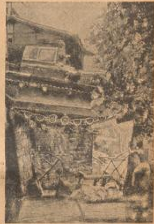
Tanz in wenig angenehmer Lage!

Mit dem Transportschiff „Montala“ trat das Post- und Passagieramt von Sankt-Petersburg und die Rote Armee nach Indien an. — Der Kapitän und die Besatzung der „Montala“ sind im Bild auf dem Deck zu sehen. (Schreib, Jänner-31.)