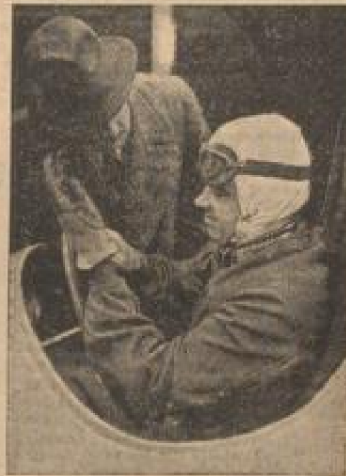
Rudolf Caracciola kurz vor dem Start mit seinem Mercedes-Benz-Rennwagen

siegreich hervorgegangen. Während des Bestehens der 750 kg Rennformel gewannen die deutschen Farben in den letzten vier Jahren von 23 Großen Preisen 19, davon Mercedes-Benz allein 12. Außerdem wurde