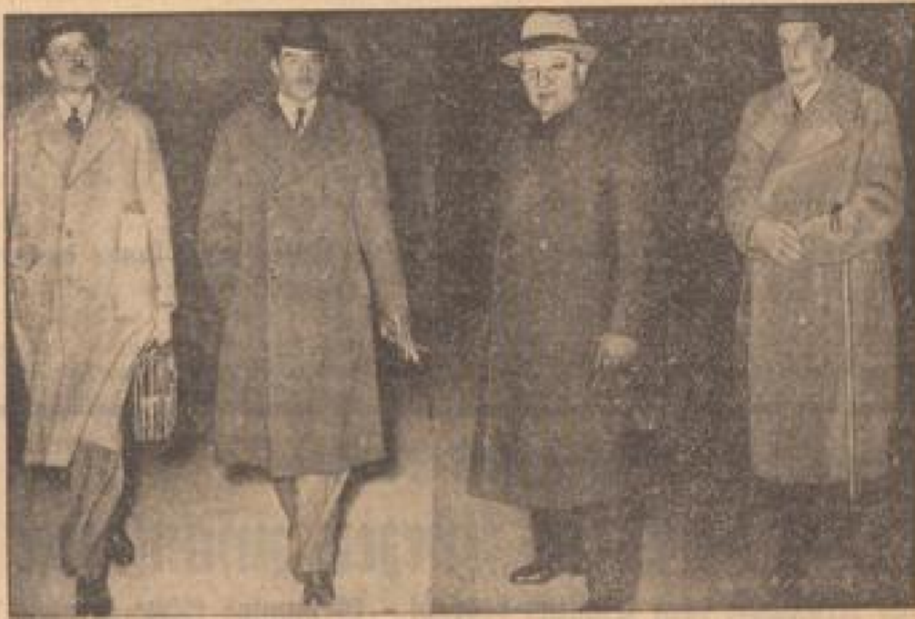
Links: Die Ankunft des englischen Außenministers Eden auf dem Flughafen in Genf. Der französische Außenminister Laval mit dem polnischen Außenminister Wed (Mitte) bei ihrer Ankunft. (Freitagblatt 2. Januar 1938)