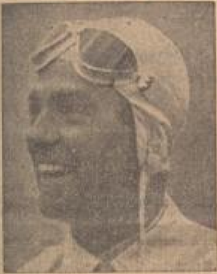
Bernd Rosemeyer (1894-1938)