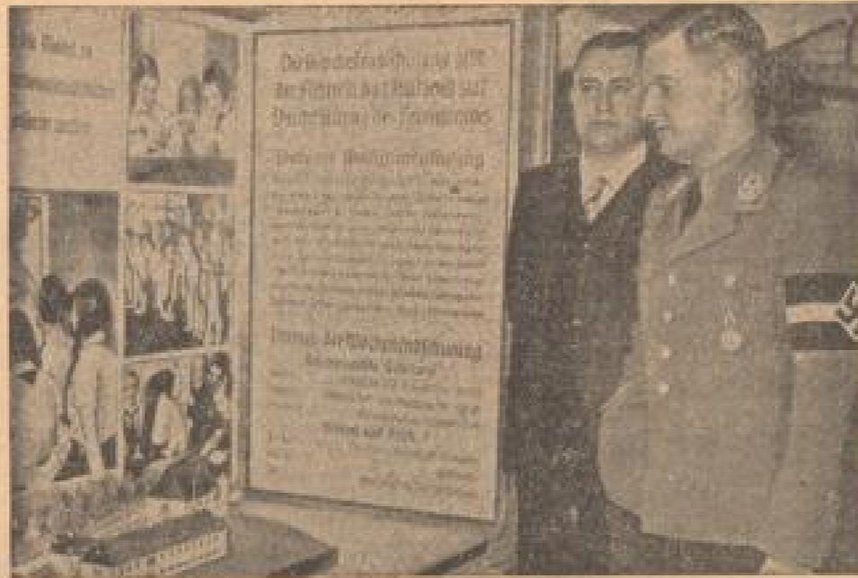
Der Jugendführer des Deutschen Reiches, Reichler von Schirach, eröffnet in Berlin die propagandistische Aktion für die HJ-Heimkehrerhilfe 1938.

Die Heime der Hitler-Jugend sind Erziehungsstätten einer Generation, die dazu ausersehen ist, die Zukunft des Reiches zu sichern.