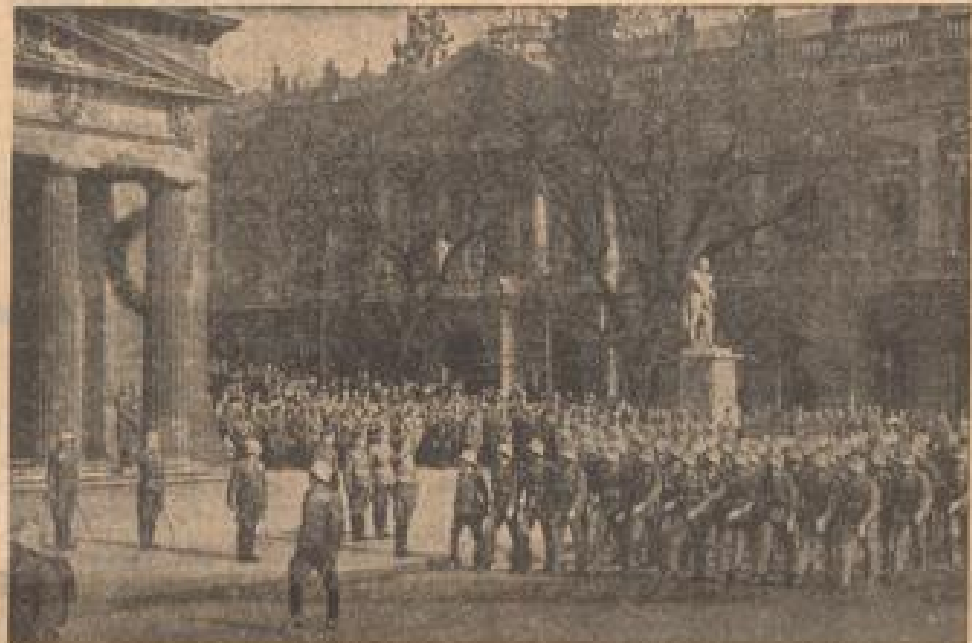
In einer Parkanlage ...