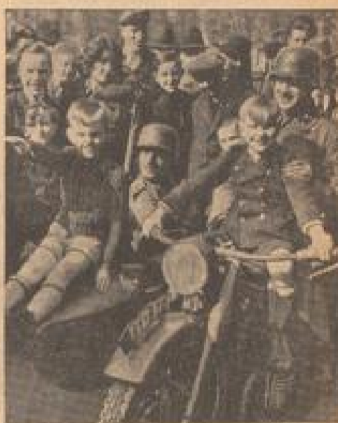
Ein Besuch für die Wiener Jugend. Eine Partei mit tschechischen Soldaten auf dem Roten Platz.

Wegen Chamberlains Ausführungen nahm dann der Oppositionsführer, Major Attlee, in scharfen Wendungen Stellung. In dem er erklärte, auf der Basis der Rede Chamberlains sei es nicht möglich, die Sicherheit des Friedens zu sichern. Er müsse seinem Erstaunen über die Leichtgläubigkeit Chamberlains Ausdruck geben. Nach einigen weiteren Ausführungen über die italienische Intervention in Spanien erklärte Attlee schließlich, Chamberlain habe letzten Endes England und die Welt auch diesmal in einer Lage gelassen, wie sie 1914 behanden habe. Die britische Regierung lasse den Dingen ihren Lauf, und verurteile niemand, mit politischen oder wirtschaftlichen Angelegenheiten sich aufzuheben. Nichts sei aber im gegenwärtigen Augenblick so gefährlich wie dieser Kurs, der Unzufriedenheit.