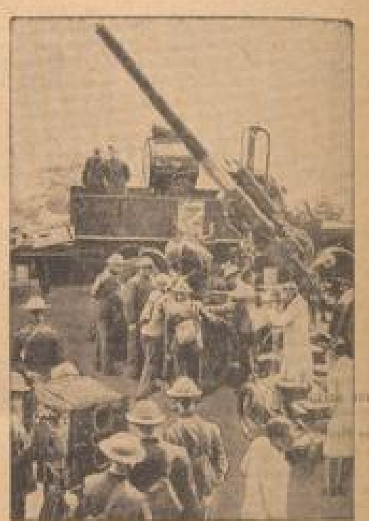
Luftangriff und Abwehrmanöver durch Feuerstürmer übertragen

Der englische Rhythmus wird in der St. Pauls-Kathedrale in London durch eine Aufführung des Rhythmus des Rhythmus geehrt.