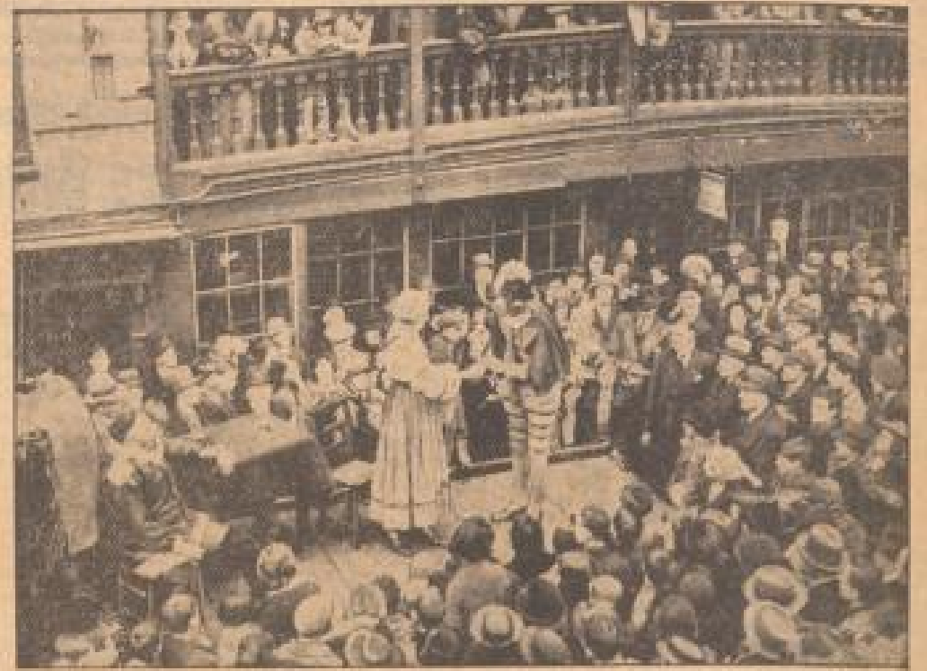
Shakespearefest in London

Das Gedächtnis des großen englischen Dramatikers wird in London durch ein Shakespearefest geehrt. Unter Bild zeigt eine Aufführung, die anlässlich des Gedächtnistages stattfand.