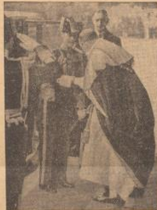
Der englische Rhythmus in der St. Pauls-Kathedrale

Das Gedächtnis des großen englischen Dramatikers wird in London durch ein Shakespearefest geehrt. Unter Bild zeigt eine Aufführung, die anlässlich des Gedächtnistages stattfand.