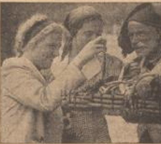
Die Medaillon-Fahrer grüßen aus Vissalon

Ein richtiger Weltkoffer, wie man ihn in den britischen Weltreich findet. Er ist ein Koffer, der in den britischen Weltreich gefunden wurde. Er ist ein Koffer, der in den britischen Weltreich gefunden wurde. Er ist ein Koffer, der in den britischen Weltreich gefunden wurde.