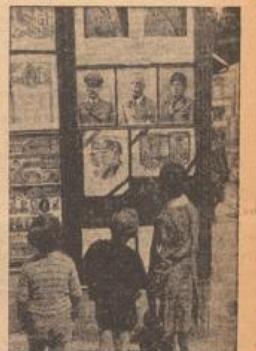
Rom im Zeichen des Führerbesuches

Die Medaillon-Fahrer grüßen aus Vissalon. Sie sind eine Gruppe von Menschen, die in Vissalon gefunden wurden. Sie sind eine Gruppe von Menschen, die in Vissalon gefunden wurden. Sie sind eine Gruppe von Menschen, die in Vissalon gefunden wurden.