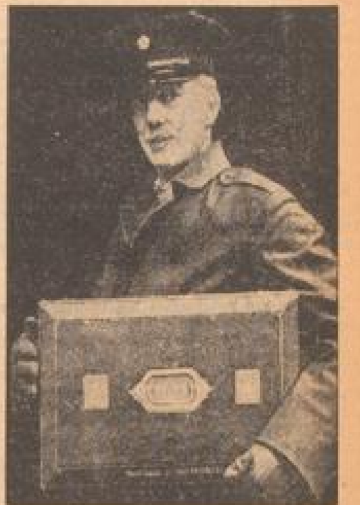
Der interessenreiche Koffer im britischen Weltreich

In dem Bildchen, die Uhrmacherin des Bildchen, ist eine Frau im Alter von etwa 40 Jahren, die in der deutschen Hauptstadt Berlin eine mechanische Uhrmacherwerkstatt betreibt. Sie hat sich durch ihre Erfindungen in der Uhrmacherkunst einen Namen gemacht. Sie hat eine neue Art von Uhrwerk erfunden, die sich durch ihre Einfachheit und Genauigkeit auszeichnet. Sie hat auch eine neue Art von Uhrwerk erfunden, die sich durch ihre Einfachheit und Genauigkeit auszeichnet. Sie hat auch eine neue Art von Uhrwerk erfunden, die sich durch ihre Einfachheit und Genauigkeit auszeichnet.