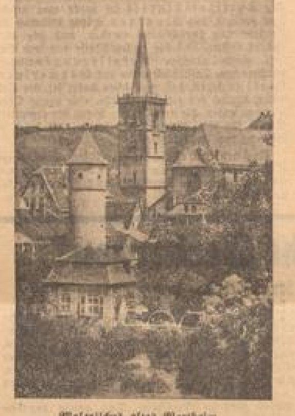
Malerisches altes Wertheim (Radio HNS)

Das sauberste schöne Städtchen am Zusammenfluss von Main und Tauber im frischen Grünland dieser Malerstadt gibt den hervorragenden Hintergrund für die Festtage. Der Kreistag beginnt mit der Hünfeldener Fahrt am Ost-Weiß-Platz nach dem Rathaus am Kaffeetisch, wo dann zu Ehren der Götter ein Kranz niedergelegt wird.