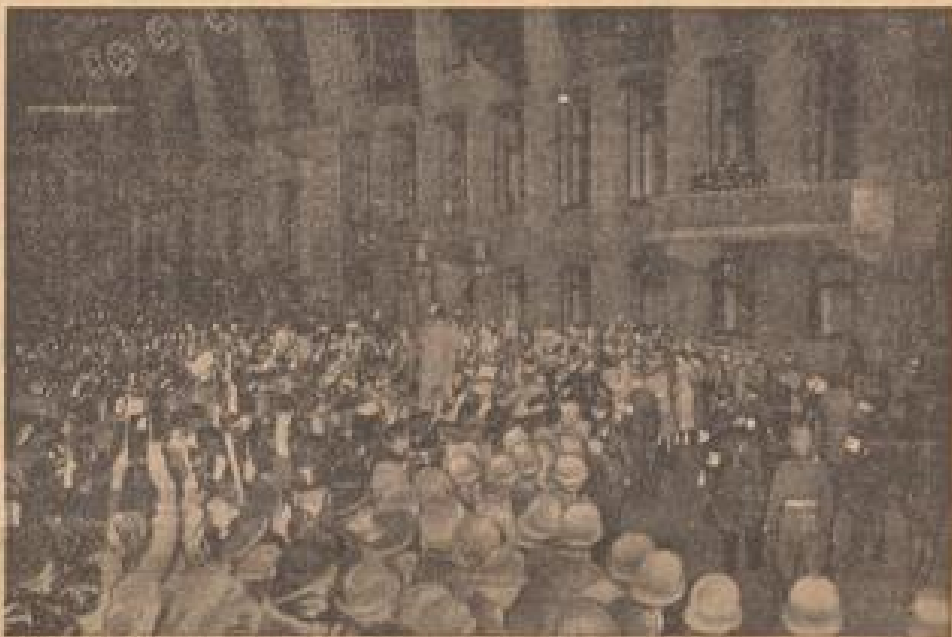
Wehrmännern mußte sich der Führer nach seiner Rückkehr aus Italien auf dem Balkon der Reichskanzlei der jubelnden Menge zeigen.

Aber ebensowenig — um einmal bei dem militärischen Bild zu bleiben — kann die Krone der Arbeit ihre nichtalltäglichen Aufgaben lösen, wenn wir jedem „Mittelmann“ erlauben wollen, nach eigener Vorliebe zu seiner Truppenausstattung zu gehen, die er für die „Leinwand“ hält oder deren Kontur ihm am besten gefällt. Es ist über die Krone wie das des Werkzeugs braucht jeden dienstfähigen Mann, aber wie jedes