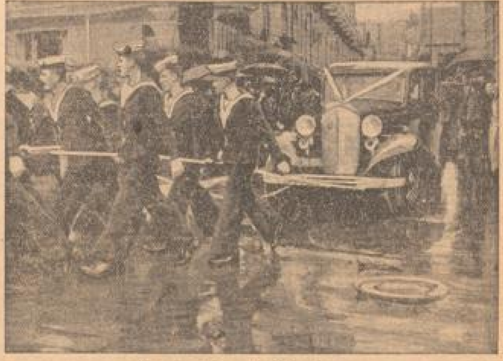
Matrosen ziehen das Bootspost... (Caption describing the scene of sailors pulling a boat post)

Die Leute wuchsen zu Büschen, doch keine Trümpfe der wilden Fluge der Insel retten konnte. „Gesegnetes Eiland der Einsamen“ — tief der Besucher unwillkürlich aus, — als kann nicht begreifen, warum Alexander Selkirk die Insel verließ.