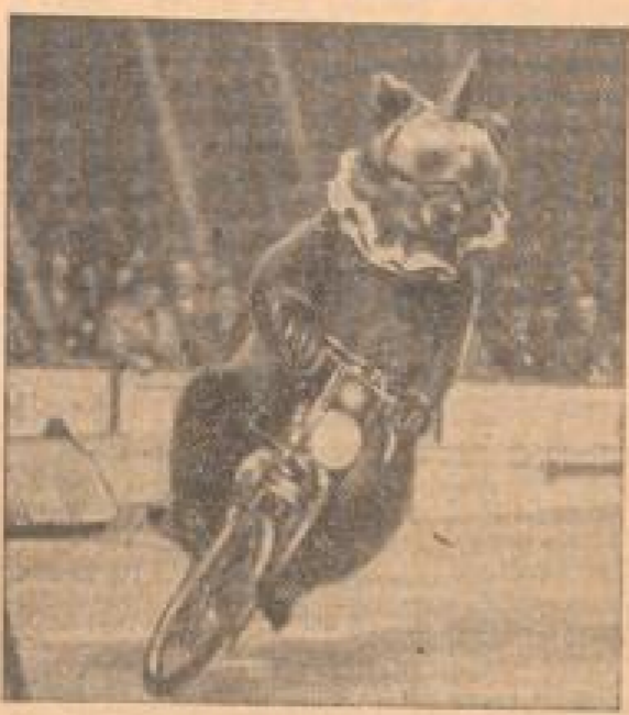
„Freig“ führt Motorrad. Natur: Reine.

und gar an der doppelten Verbe in 14 Meter Höhe auszuführen wird, hält den Zuschauer in ständiger Erregung. Und wenn die hübsche blonde Frau an der japanischen Leiter, die auf den Schultern eines