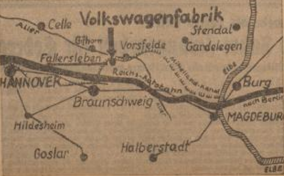
Im Bild oben ist eine Karte der Volkswagenfabrik, die den Standort in Braunschweig zeigt, umgeben von den Orten Cella, Fallerleben, Stendal, Gandellegen, Burg, Magdeburg, Halberstadt, Goslar, und Hannover.

Das Werk "national" habe ich; es ist an allen Ecken und Enden leichter Menschen gewesen, die es nicht wagten, große Entschlüsse zu verwirklichen.