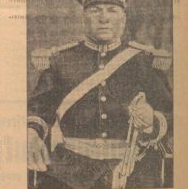
Herr ... ist ein General ...