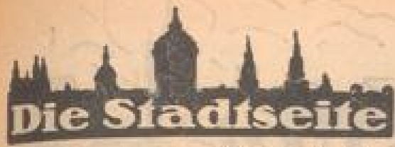
Mannheim, 8. Juni.