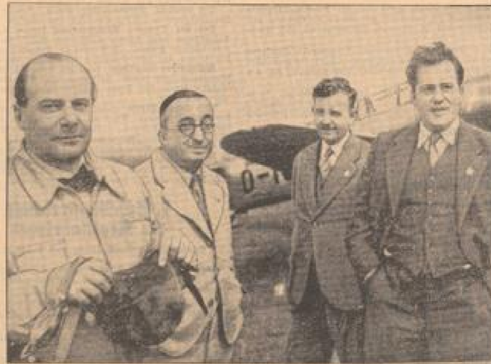
Über Hiert 634,370 Stundenkilometer