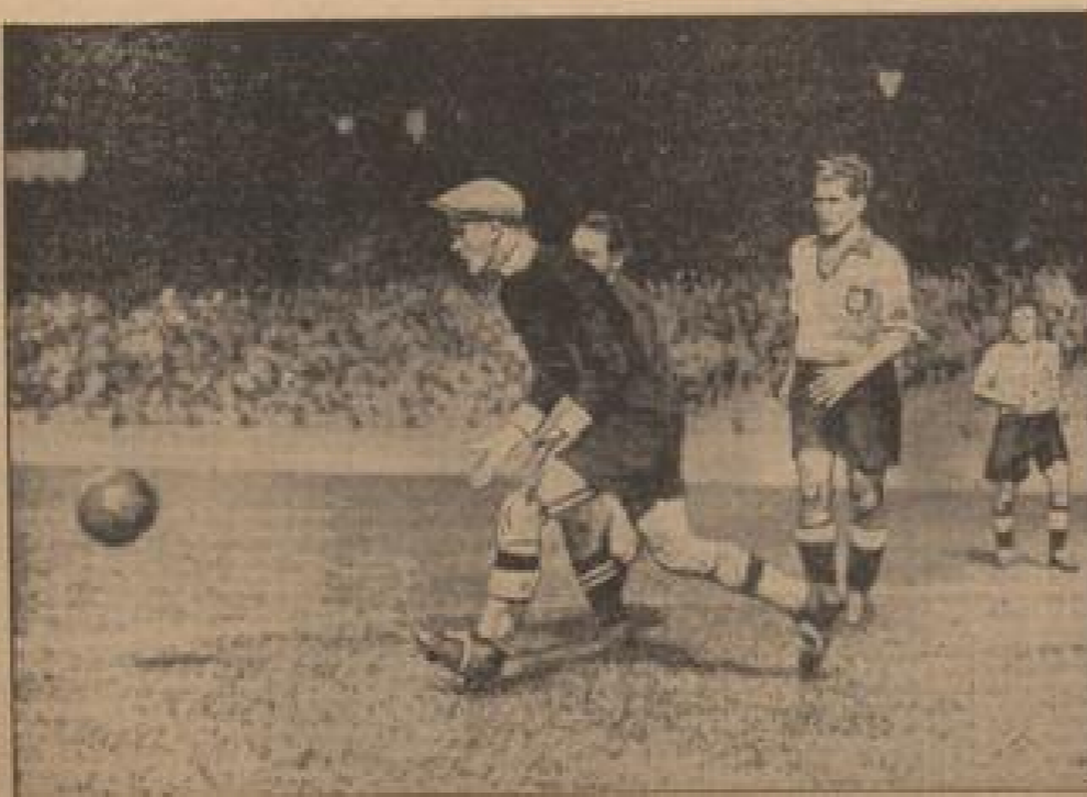
300. Spieltag wurde der Weltmeisterschaft eingeleitet. Der Kampf endete unentschieden, und das Spiel wurde durch beide Halbzeitpausen...