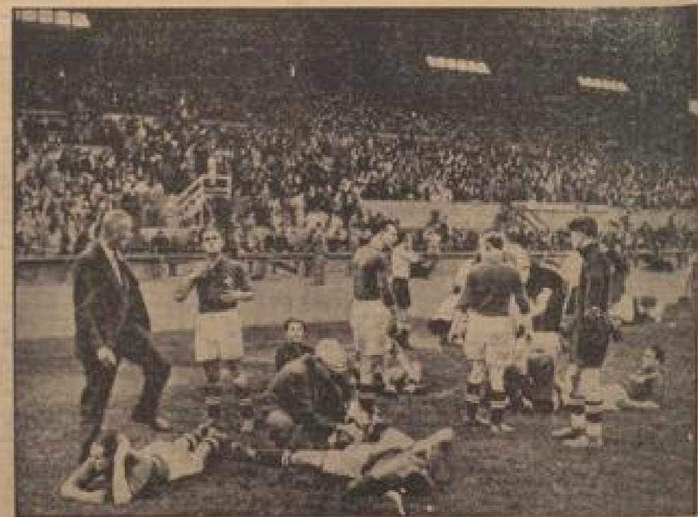
Die WM auf der Sports-Gelände: Vorbereitung der WM-Spieler bei den Spitzengruppen...