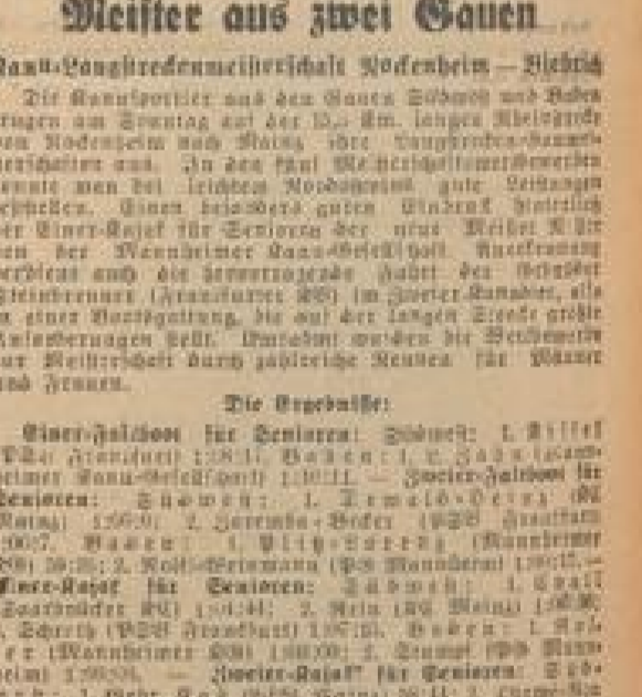
Meister aus zwei Gauen. Die Fahrer der Mannschaften waren: ...