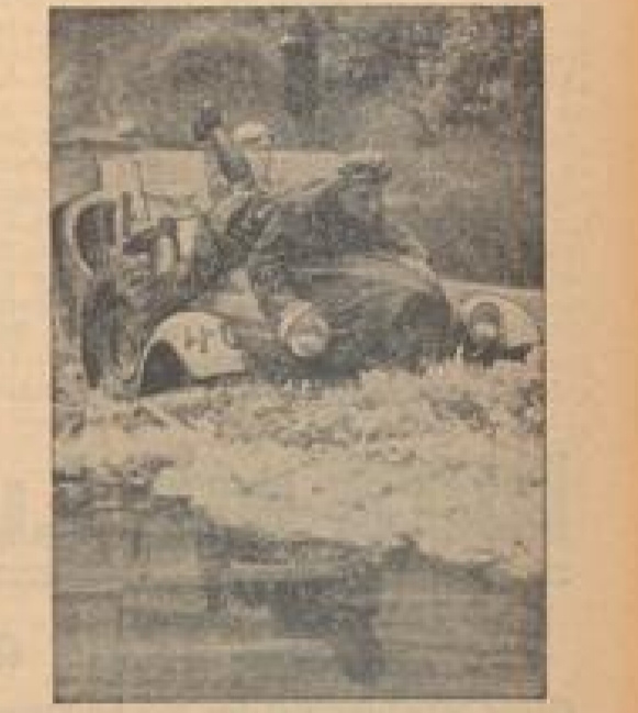
ES-Fahrer meisterten Gelände. Die Fahrer der Mannschaften waren: ...