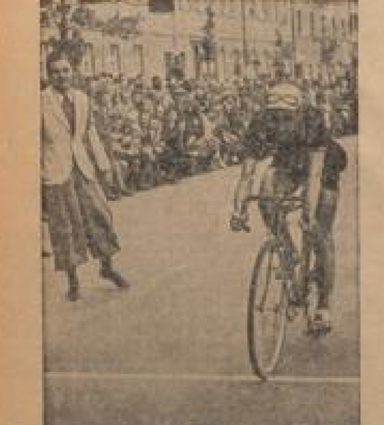
Bierstadt (Schlösschen) Stappensieger vor Oberstedt. Die Fahrer der Mannschaften waren: ...