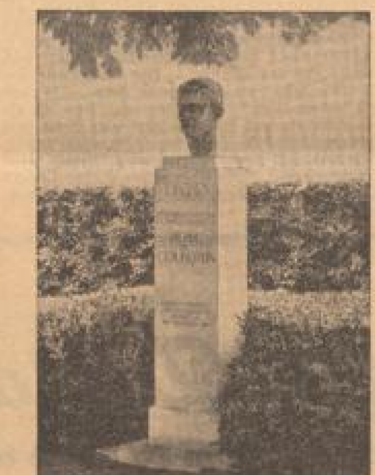
Gautillinger. In Föhren des Denkmal, das

Baden-Baden, 27. Juni. Im Verlauf des deutsch-französischen