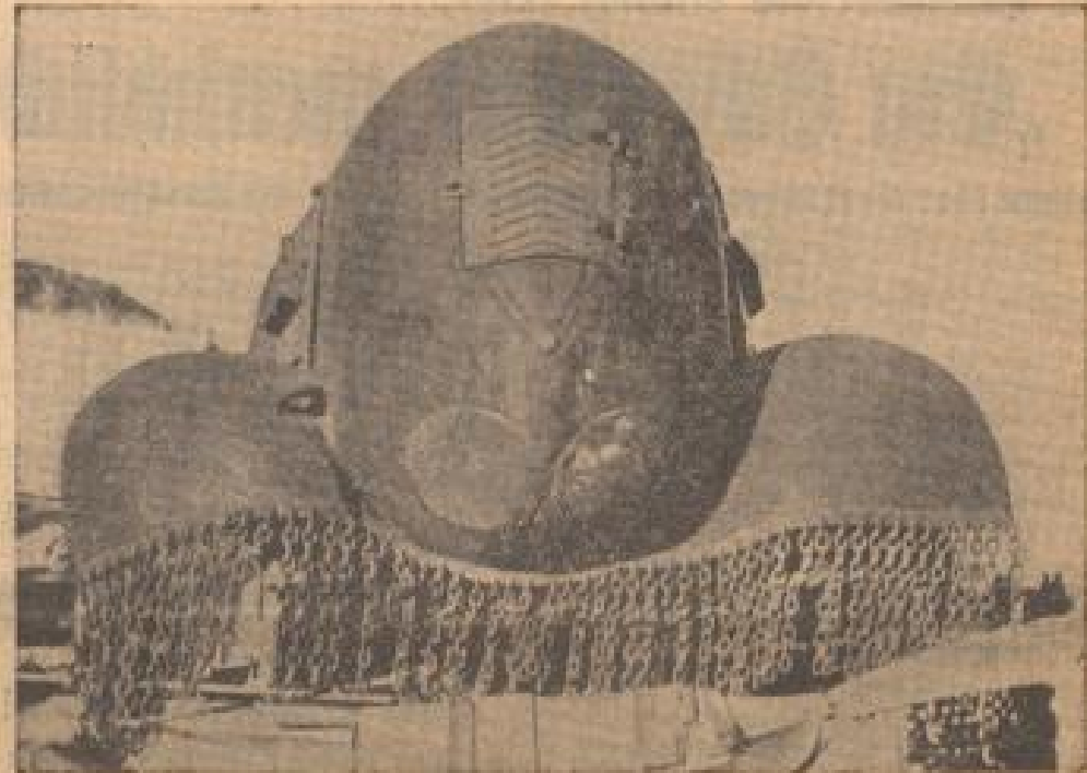
Ein erbeuteter (sowjetischer) Tank (Vorderhaus, Sonder-Nr.)

Trotzdem läuften Notorboote für die niederländische Kriegsmarine. Die niederländische Kriegsmarine läßt von einer englischen Werft bei Southampton dreißig schnelle Notorboote bauen, die für das Aufheben von U-Booten bestimmt werden sollen.