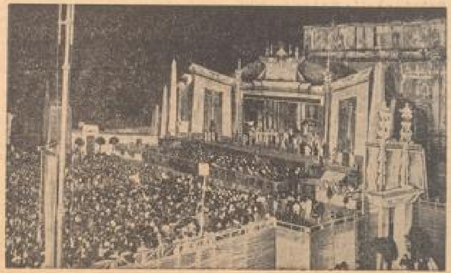
„Nida“ vor dem Weltkrieges „Arbeit und Freude“

Der künstlerische Oberhaupt des Weltkrieges „Arbeit und Freude“ in Rom bildete die Festschaltung der „Nida“ unter hellem Himmel in Anwesenheit des Duce. Unter Aufsicht des mittelmäßigen Bildhauers von dem schlichten Rahmen der Architektur, die neben der überhöhten Statue des Kapitols unter Aufsicht von Benvenuto Cellini und Ottaviano Nanni verfertigt wurde. (Wolff-Gottmann, Sonder-Multiflex-2.)