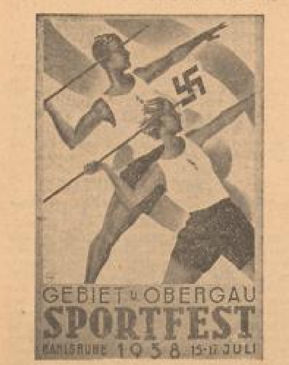
GEBIETS- und OBERGAU-SPORTFEST KALLGRIEBE 1938 13-15 JULI

Haus und Hof, Höhenlagen, Berg und Ang... (Text about the camp's location and facilities)