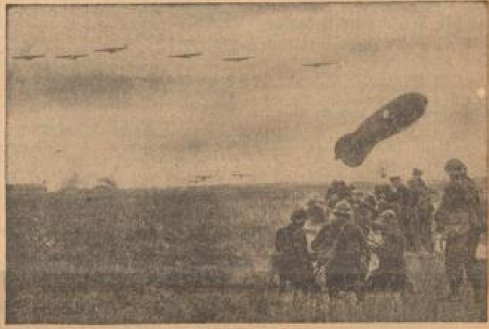
Diese siebenköpfige Staffe ...