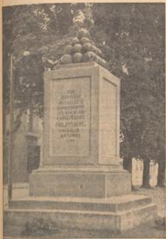
Dieses Denkmal mit seinen historischen Kanonenkugeln erinnert heute an das mörderische Bombardement der alten Festung im September 1793. — Die Kugeln wurden damals von französischen Batterien in die Stadt geschleudert.

Ein Denkmal mit Kanonenkugeln, 13 Häuser und zwei Grabmäler sind alles, was an die untergegangene Festung des alten Reiches erinnern — Die wiedererstandene kleine Stadt feiert Jubiläum