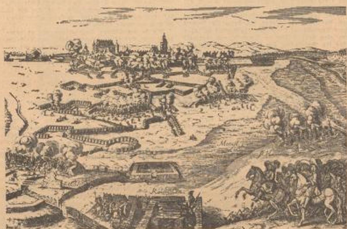
So hat eine Belagerung der wichtigen Reichsfestung am Oberrhein durch eine französische Armee im sechszehnten Jahrhundert ausgesehen. Seltsamerweise karikiert im Bild des Mannheimer Stadtmuseums.

Während der Streitigkeiten, die die Stadt Speyer in den Jahren 1381 bis 1438 mit ihren Bischöfen auslöste, bezogen die Pfälzer in Udenheim ihre Residenz. Siegfried von Remlingen baute 1459 wie sein Vorgänger an dem bereits im Verfall befindlichen Schloß und ließ im Hof desselben einen hohen leeren Turm errichten, worin sich ein Versteck der Fortifikationen späterer Zeiten. Bischof Neufville von Ransung richtete in