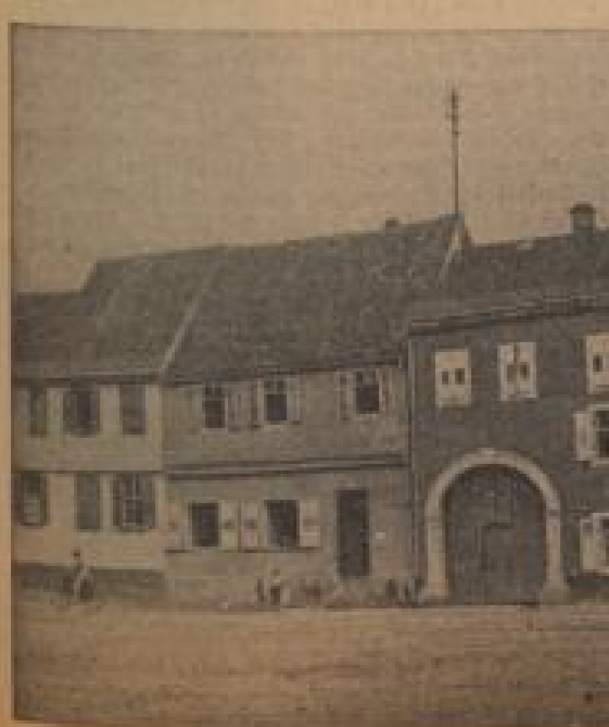
Das sind die drei ältesten Häuser von Philippsburg. Sie sind noch Zeugnis des Unterganges der alten Reichsfestung geworden.

Sanktadel der großen Mächte Es hat ununterbrochenen Turm und freigelegter Festung ist eng mit dem einstigen Philippsburg, auf diesen Trümmern die neue Stadt entstand, verbunden. Zwei Jahrhunderte lang hat dieser von französischen oder französischen Architekten und Ingenieuren immer neu und immer härter befestigt