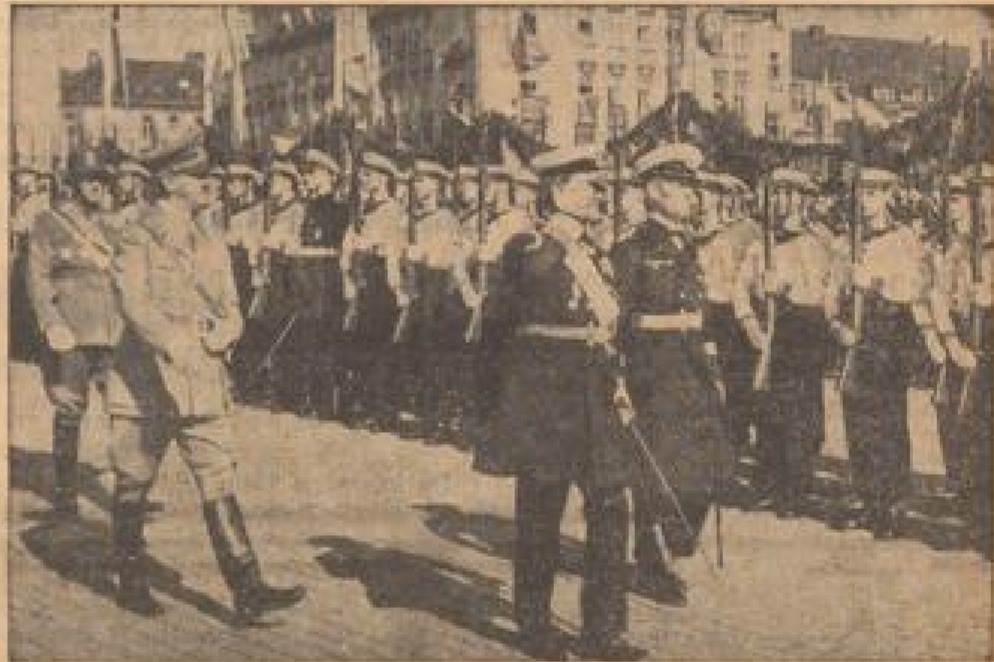
Der Reichsverweser Gorthn (Mitte) zusammen mit dem Reichsminister für Kriegsmarine in Kiel. Im Hintergrund ist der Kiel der Reichsflotte zu sehen.

In der Tat scheint es denn auch, als ob die Opposition der marxistischen Parteien und der Gewerkschaften sich nicht in einem Kompromiß befriedigen lassen könnte. In Kiel, der Reichshauptstadt, wird sogar darauf hingewiesen, daß eine Basis für eine Verständigung auf diesem Gebiet erstellt werden könnte, wenn nämlich die Verhandlungen über die 40-Stunden-Woche mit einem Erfolg von 10 u. D. beendigt würden. Die CGT geht soweit, eine genaue Ziffer zu nennen, nämlich einen Erfolg von 25 vom Hundert.