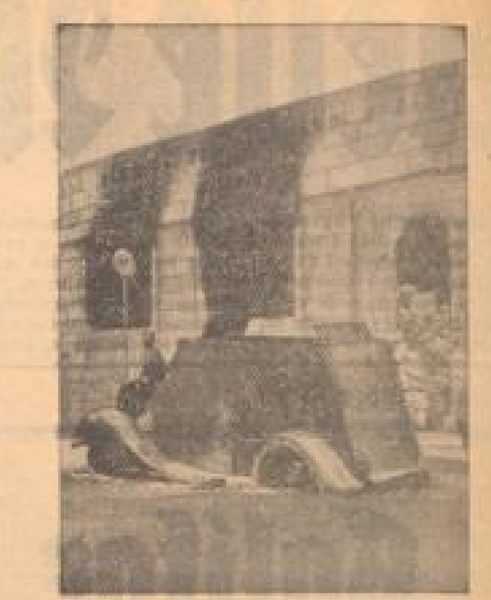
Die Kämpfe in Palästina haben weiter an Heftigkeit zugenommen...