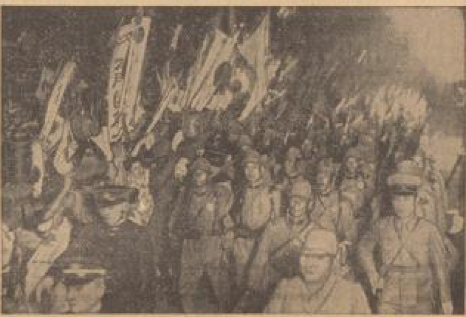
Eine nach Obererinnern abziehende Revolutionen begrüßt mit Fahnen, Reden und Gesängen eine von der Front aus ...

In Großbritannien hat es niemals einen Zweifel über die Natur gegeben, die von der tschechischen Regierung verlangt werden. Die öffentliche Meinung stimmt von 1918 bis heute grundsätzlich darin überein, dass eine Übereinkunft