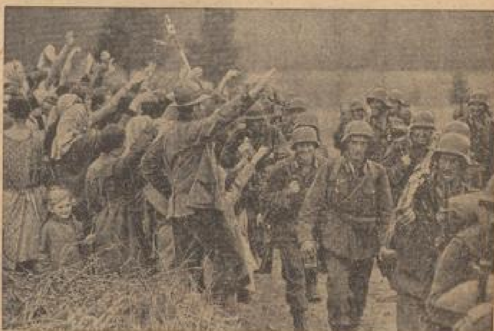
Grenzübertritt deutscher Truppen bei Feldmühle im Böhmerwald (Scharf-Schönbach, Jauer-Bl.)