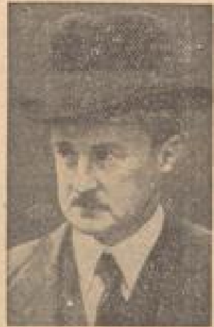
Duff Cooper

Außer dem Marineminister Duff Cooper sind bekanntlich der Gesundheitsminister Elliot, der Handelsminister Oliver Stanley und der Vordirektor-