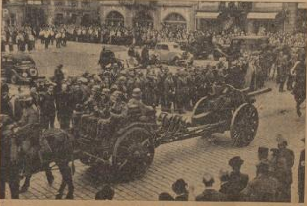
Seppanie Artillerie fährt über den Marktplatz von Rumburg (Wolff-Schönborn, Jauer-Bl.)