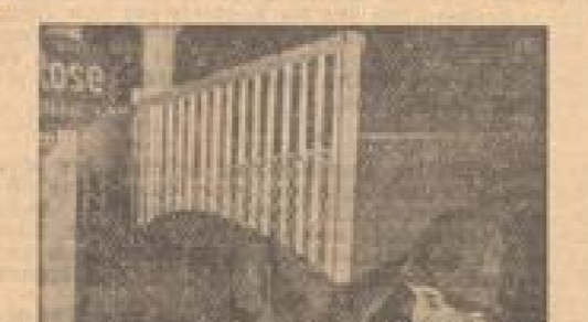
Therese Krenz gestorben