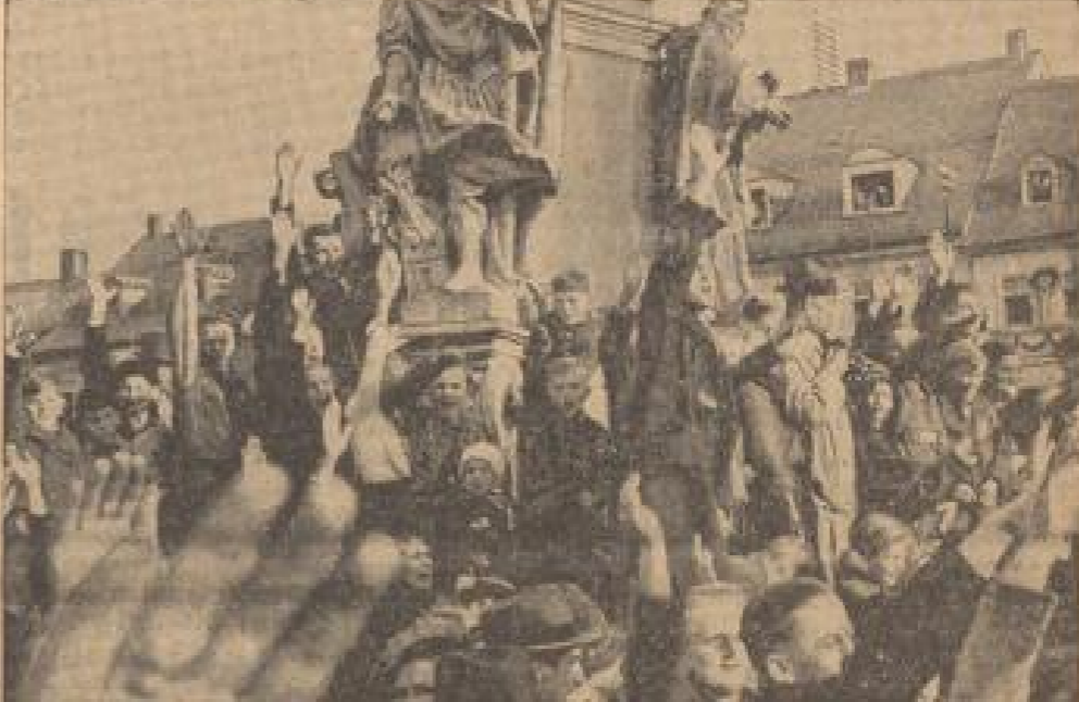
Unbeschreibliche Freude in Eger (Mühlentisch, Dresden-Bl.)