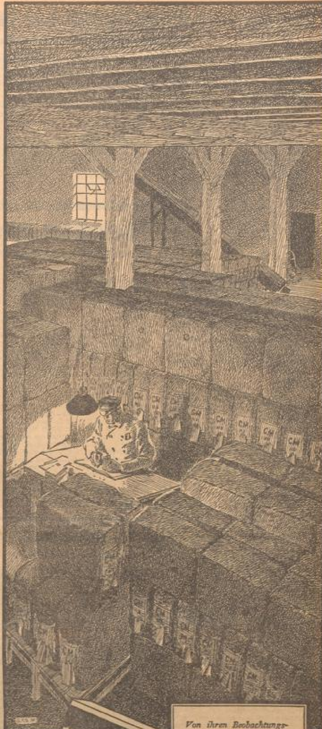
Von ihren Beobachtungsposten aus überwachen die Tabakmeister den Verlauf der Fermentation.

Der Wettbewerb beginnt am Sonntag, dem 11. Oktober, um 11 Uhr im Saal des Schauspielhauses.