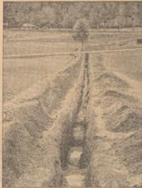
Schäden und Verwüstungen erstrecken sich weit in die Täler hinein, um den Feindern die Eroberung zu erleichtern. (Wilmann, Sonder-Nr.)