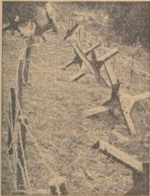
Drahtverhau und Sperrholz-Halter schützen die Schöberlinie. (Wilmann, Sonder-Nr.)