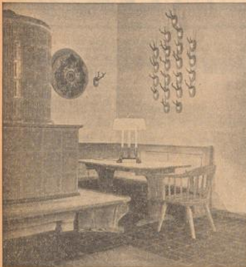
Der Stolz des Hais manne: ein hiesiges Jagdhorn Einmalig und höchst wertvoll.

Schäde, als daß sie im einzelnen aufgeführt werden könnten. Aber aus einem auch für den Laien interessanten Gebiet seien hier einige Proben entnommen; aus dem Abwechslungsreichen Gebiet der Wildbildungen bei Hirschgeweißen und Rehgeweißen.