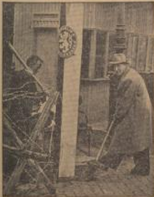
Im tschechischen Widerstandskämpfer in der Region von Tschuden wurden nunmehr gründlich die Verwüstungen beseitigt. (Wiese-Gottmann, Sonder-Nr.)