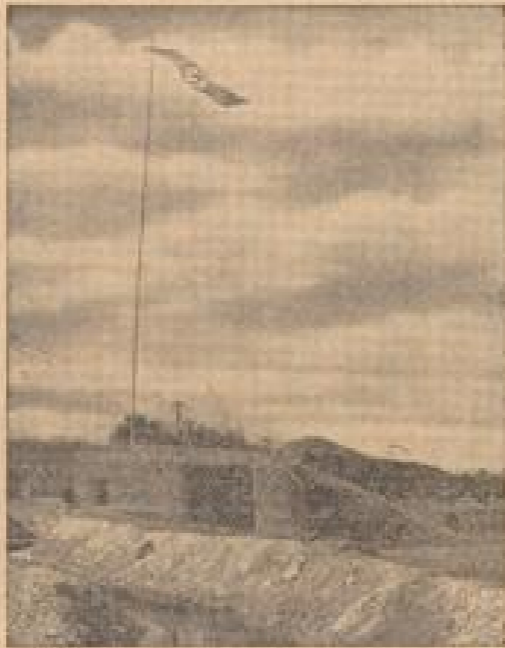
Nach der Eroberung der „Schöberlinie“ flieg am Berg die deutsche Fahne hoch. (Wiese-Gottmann, Sonder-Nr.)