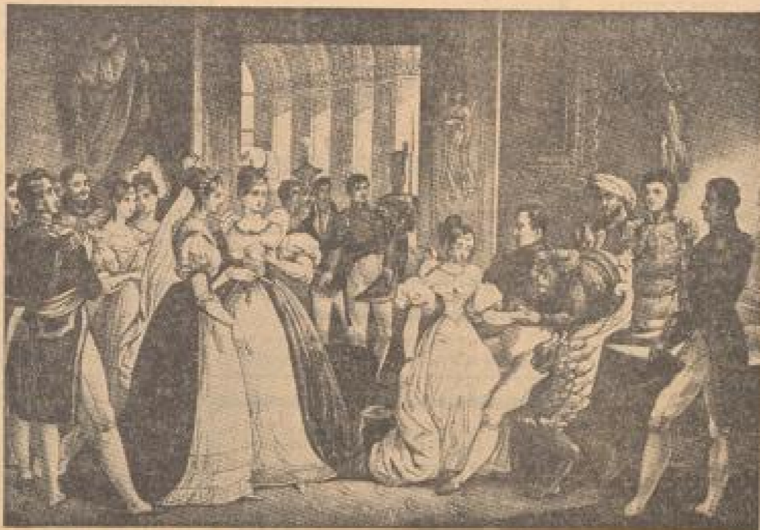
Napoleon nimmt seine Adoptivtochter Stephanie während eines Balles auf seine Arme (König RMZ)

berg erhalt die Erlaubnis, in badiße Dienste zu treten, zum laudwürdigen Mitarbeiter und findet einen früheren Beamten des kaiserlichen Amtes, de Ragnacal, und einen Advokaten Francois de Pons, tut so, als ob er insgehört einen Auftrag von der französischen Regierung habe, um mit den beiden ankommen die Rolle von Reformatoren eines Rhein-