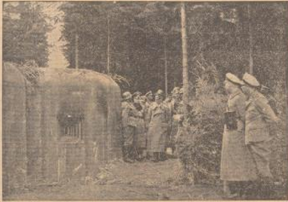
Der Führer vor einem typischen Betonbunker

Mit Hilfe französischer Festungsbauer hatte die Tschecho-Slowakei in den letzten Jahren längs der Reichsgrenze, also im Sudetenland, die bekannte Schöberlinie, eine riesige Reihe von getarnten Betonbunkern, Drahtverhauen und Panzersperren geschaffen