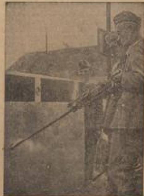
Im der tschechischen Wehrmacht werden in Gegenwart der Wehrmacht von Tschechen die Landsperrung beseitigt, die von den Tschechen errichtet waren. (Wiese-Gottmann, Sonder-Nr.)