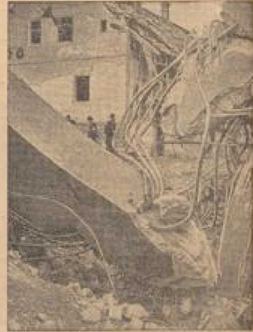
Die gesprengte Straße in Brettenfurt. (Wiese-Gottmann, Sonder-Nr.)