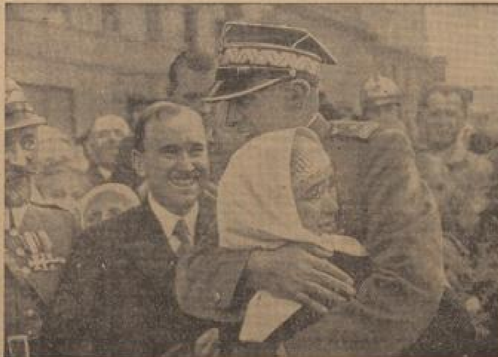
Ein eindrucksvolles Bild vom Zusammenstoß des tschechischen Widerstandskämpfers mit einem deutschen Soldaten, der die Führung und Freude in den Tagen unserer hier eine Einheit des tschechischen Widerstandskämpfers. (Wiese-Gottmann, Sonder-Nr.)