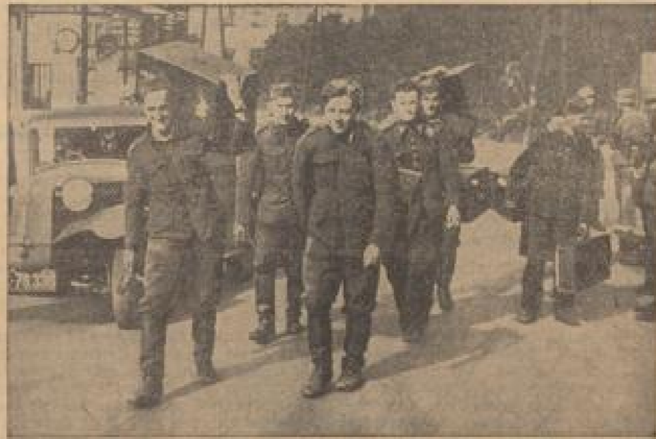
Von der Fron befreit Sudetenländische Volksgenossen, die von den Tschechen zum Militärdienst gezwungen wurden, sind jetzt zum Teil wieder entlassen worden und kehren in die befreite Heimat zurück. (Wilmann, Sonder-Nr.)