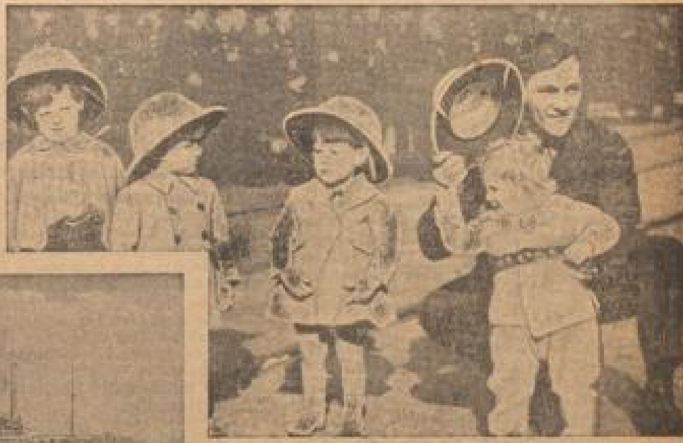
Gut „behütet“ sind diese Kinder Diese neue Bild wurde bei der Inspektion der im Haus benutzt aufgenommen. Die Jungen liefen bei im Inneren der Bilder photographieren, bevor dies auf einen Transporter über- geführt wurden. (Weiß-Geismann, Sonder-M.)