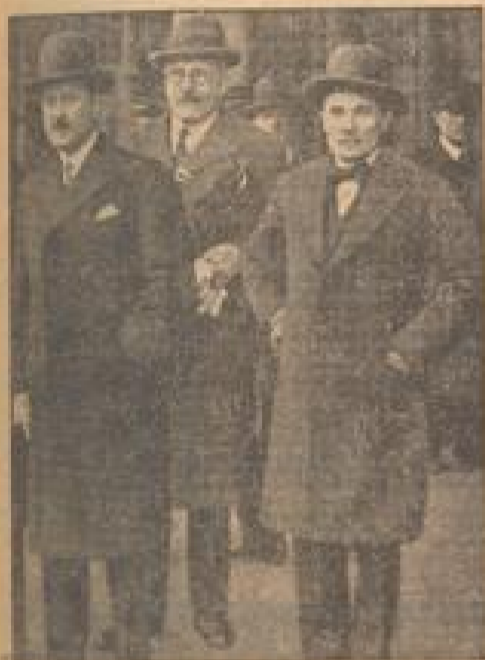
François-Botschafter für Rom und Berlin Die französische Botschafter hat jetzt ihren bisherigen Botschafter in Berlin, François-Foncel, nach Rom und Paris. (Weiß-Geismann, Sonder-M.)