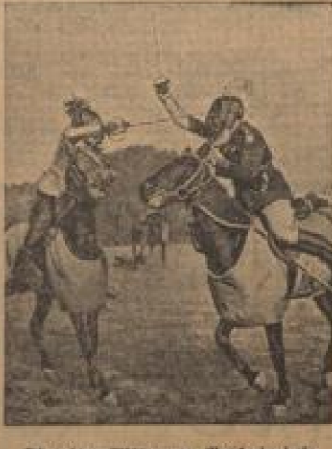
Die alten Ritter von Nordbrüggen In mittelalterlicher Art verhalten sich die Ritter der Provinz Nordbrüggen in den Niederlanden in Brügge. (Weiß-Geismann, Sonder-M.)