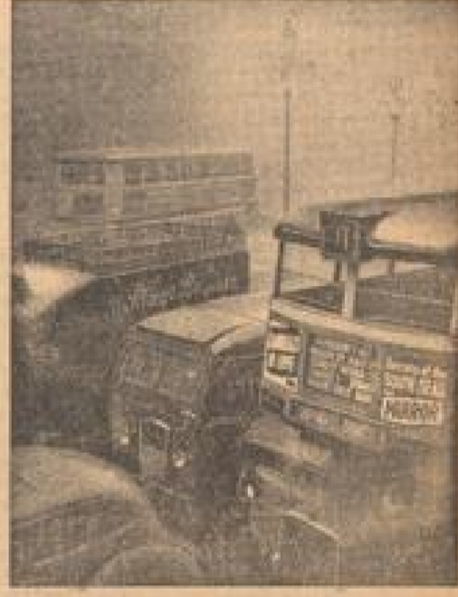
Getriebel unterhalb Lombard Strassenverle Der Straßenverle ist vollkommen im Betrieb. (Weiß-Geismann, Sonder-M.)