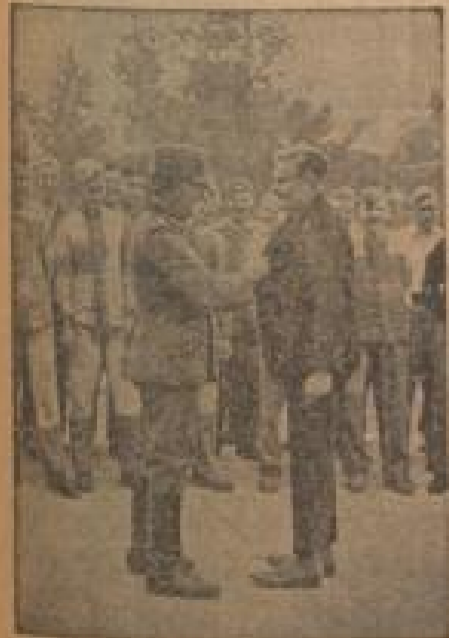
Verhandlungen vom Wehrbesuch Die Verhandlungen vom Wehrbesuch sind noch nicht im Gange. (Weiß-Geismann, Sonder-Multicolor-2.)