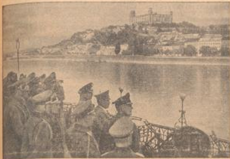
Der Führerbesuch im Gebiet von Egeran Der verweilt der Führer einige Zeit auf dem Felsberg gegenüberliegenden Donauufer. Im Hintergrund die charakteristische Silhouette Felsbergs. (Weiß-Geismann, Sonder-Multicolor-2.)