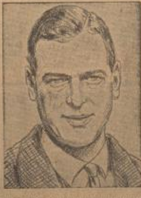
Gerzog wird Gouverneur von Australien Der Herzog von Kent hat im britischen Reich den Posten von Gouverneur von Australien erhalten. (Weiß-Geismann, Sonder-M.)