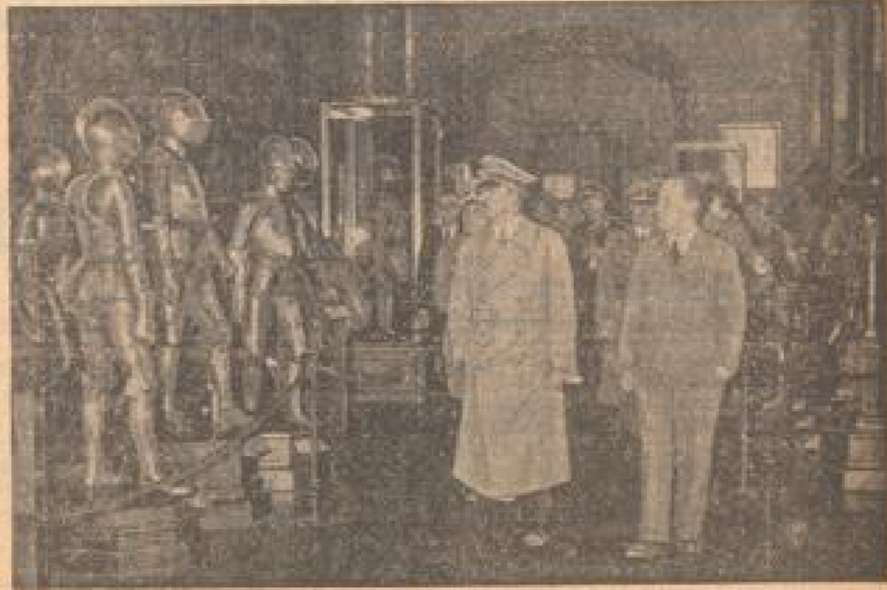
Der Führer in Wien Im Aufblick an die Reichsgrenze führt in die an die Schwart gezogenen Gebiete traf der Führer in einem unbesetzten Bereich in Wien ein. (Weiß-Geismann, Sonder-Multicolor-2.)