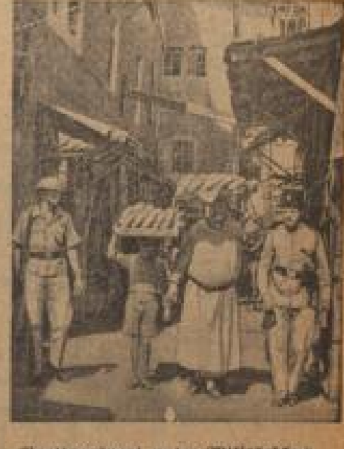
Beutransport unter Militärschutz In der Beutransport wurde von einem eigenen Bunker aus transportiert. Die Beute wurde von den Soldaten und Wagen transportiert. (Weiß-Geismann, Sonder-M.)