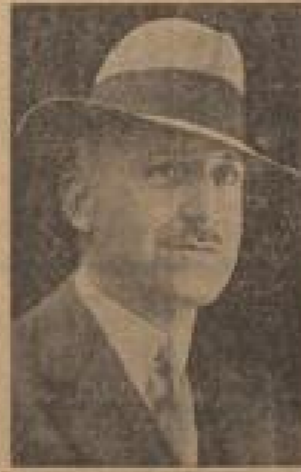
Hollands neuer Gesandter in Berlin An Stelle des bei einem Kaiser gestorbenen holländischen Gesandten in Berlin hat der holländische Gesandter in Berlin. (Weiß-Geismann, Sonder-Multicolor-2.)