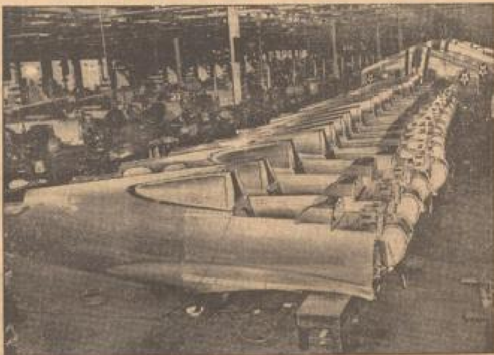
Flugzeuge der neuen amerikanischen Jagdmaschinen, die in Buffalo von der General Electric-Werkstatt für die amerikanische Fliegerarmee hergestellt wurden. Die neue Jagdmaschine ist ein Ganzmetall-Eindecker mit einstellbarem Höhenruder und einer Höchstgeschwindigkeit von 320 Meilen (New York Times, 28. 10.)