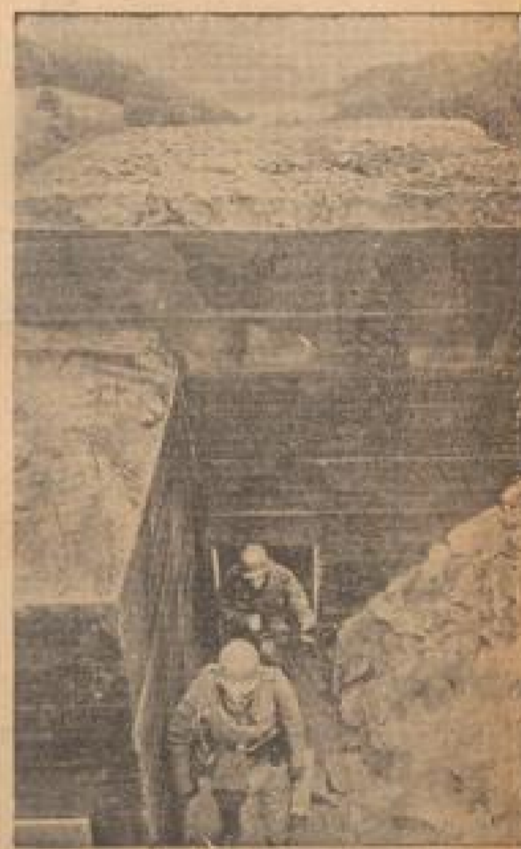
Wohlschützen verlassen einen Panzer (Eisenstein, Sommer-38)