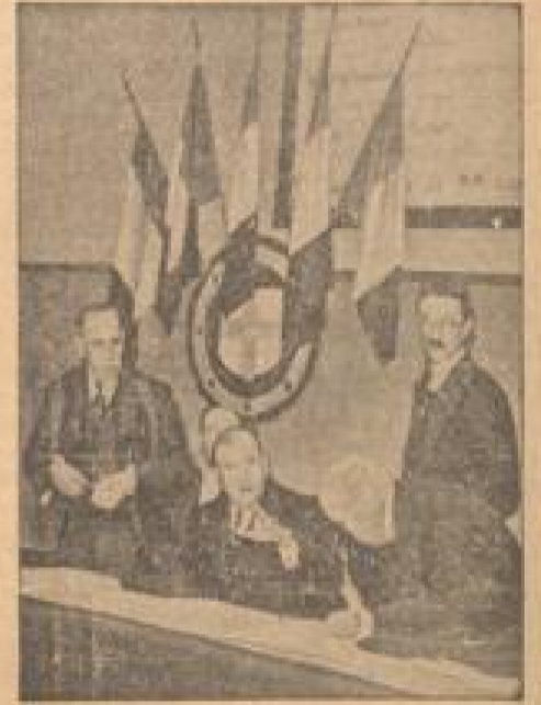
Ein Bild vom Parteitag der Sozialistischen Partei in Marseille Ministerpräsident Tardieu am Rednerpult.

Wir zeigen hier drei Aufnahmen von dem Schiffhebewerk, das den Walfisch des Mittelmeeres an die Elbe hochhebt. Es hat einen Höhenmesserhöhe von 16,5 Meter zu verstellen.