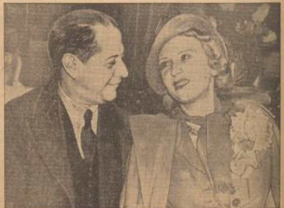
In Wallonien betrat der einjährige Ehedirektor Herr Capablanca die russische Prinzessin Olga Bogoljuboff. Capablanca ist jetzt in London. (Preßfoto, Sonder-M.)

Der französische Staatspräsident Lehmann verabschiedete eine Jagd, an welcher das diplomatische Corps teilnahm. (Preßfoto, Sonder-M.)