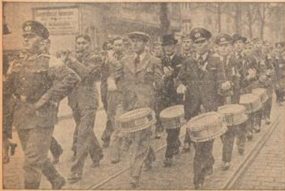
Es geht beim an Weibern.