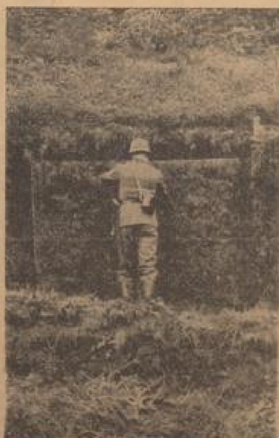
Ein gut getarnter Untergrund für Abwehrgeschütze