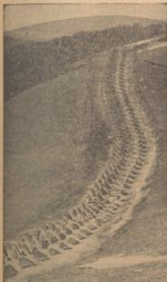
Wie eine chinesische Mauer ziehen sich Kilometerweit die Kampfwagenhindernisse durch das Land im Westen

Nach der ersten Schütze des Führers auf dem Festungsbau 1938.