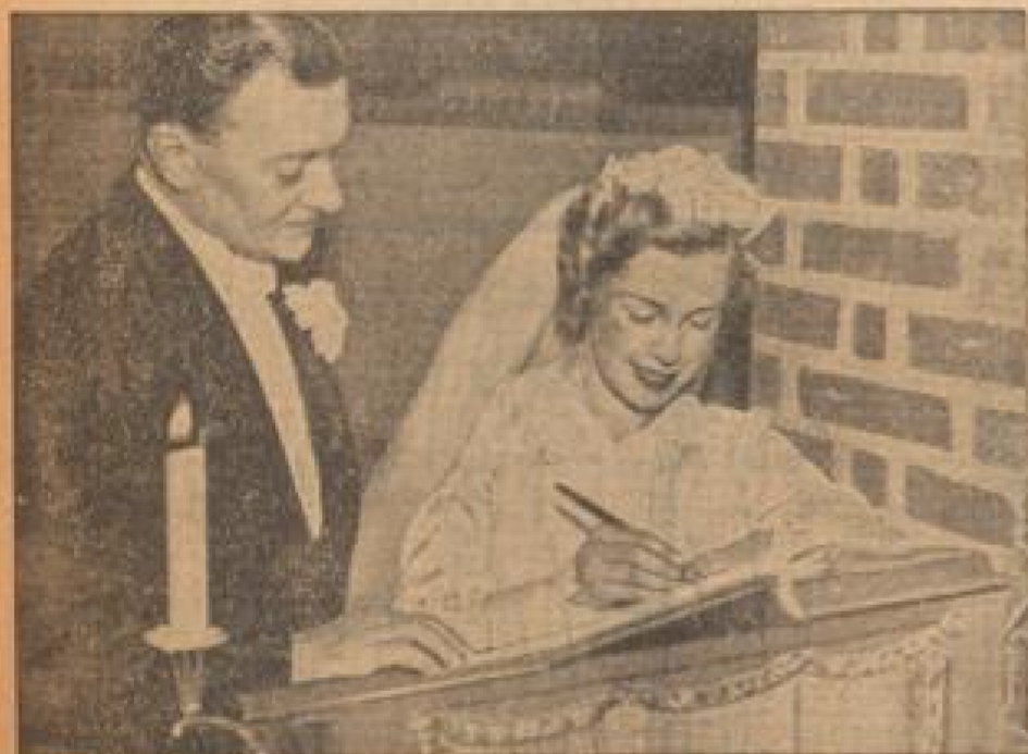
Die bekannte finnische Diplomatin Ulla-Lena Suominen verabschiedet sich in Stockholm mit dem schwedisch-amerikanischen Geschäftsträger Tjebk.