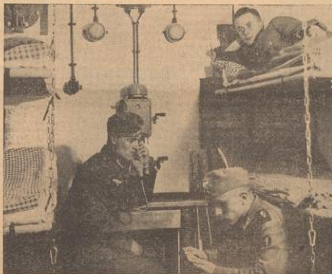
Blick in den Nachraum eines Kampfwertes