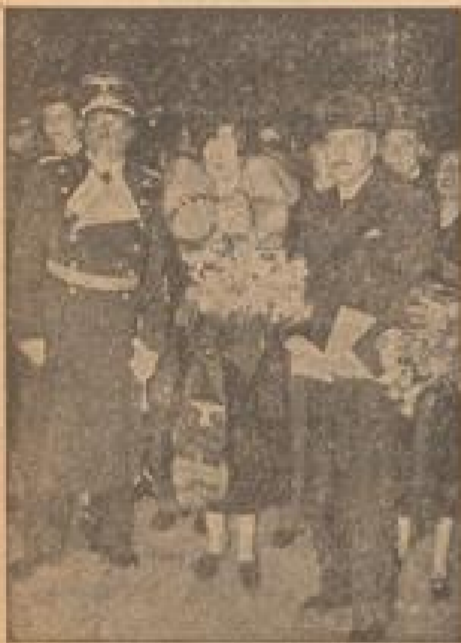
Francois-Poncet verläßt Berlin Neben dem Reichskammerleiter Staatsminister Meißner.