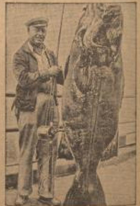
Zwei Stunden und fünfzig Minuten dauerte es, bis dieser riesige Dinger zum ersten Mal in der Welt in der Stadt von zwei Mann. (Preßfoto, Sonder-M.)

Ein Postkasten am Straßenrand in Köln ließ unmittelbar zum Postfachdienstleistungen zufließen. (Preßfoto, Sonder-M.)