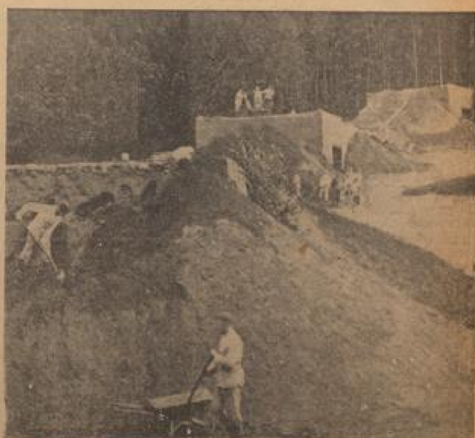
Betonbunker werden mit Erde bedeckt und gegen Beschuß getarnt (Eisenstein, Sommer-38)