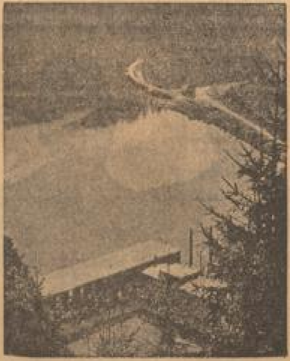
Wasser und Licht in scharfer Harmonie.