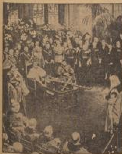
Bankett zu Ehren König Karls in der Londoner Guild-Hall König Karl von Schweden wurde während der Reise nach Stockholm in London geehrt.