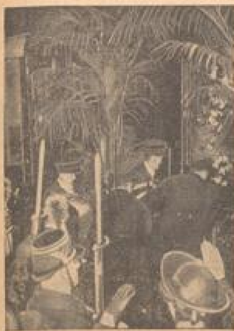
Ehrenformation auf dem Pariser Nordbahnhof Der mit der Gefangenensicherung betraute General mit in den französischen Gefangenengebiet.