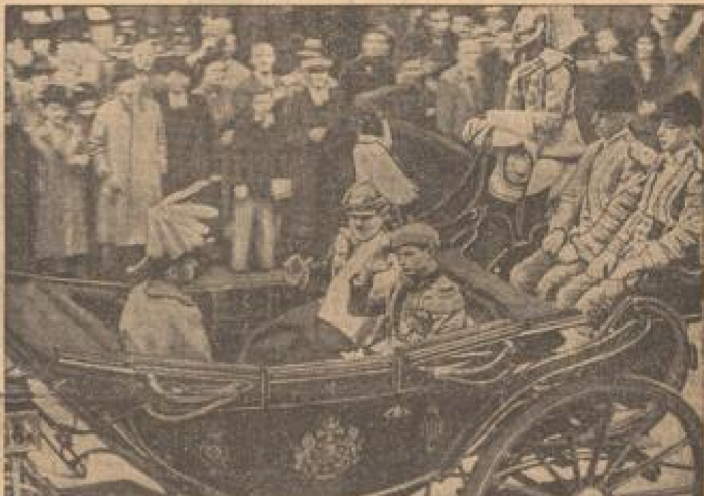
Der König und der Kronprinz auf der Fahrt durch die Stadt. (Wissenschaftl. Verh. Bucher-Bl.)