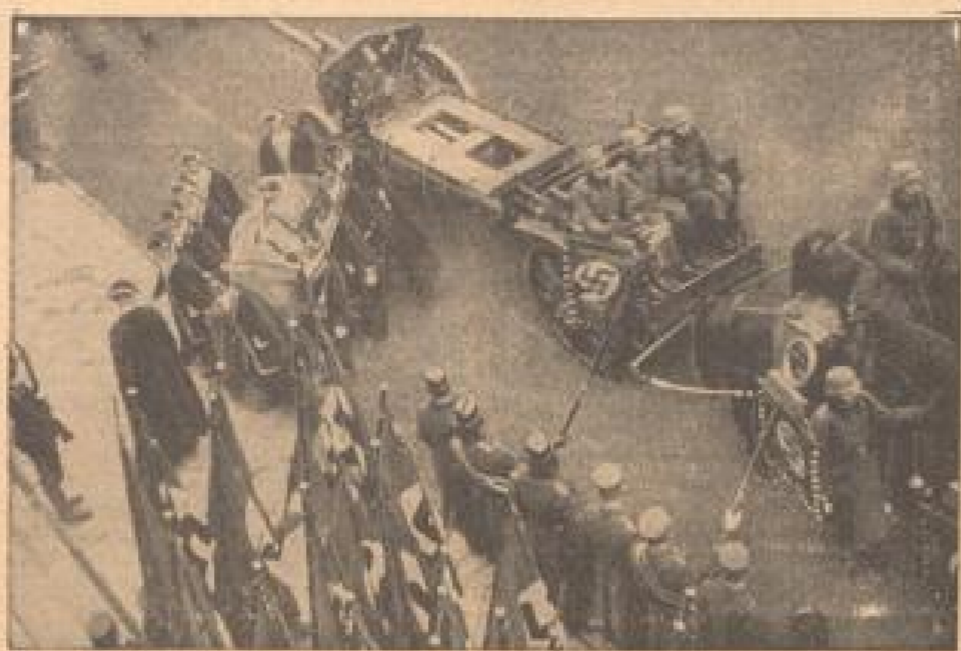
Auf einer Raquette wurde der Sarg zur Düsseldorfer Rheinhalle gebracht