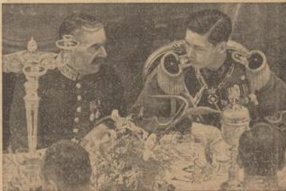
Dr. Venizelos, Ministerpräsident von Griechenland, der seinen Vater begrüßt, mit Premierminister Chamberlain.