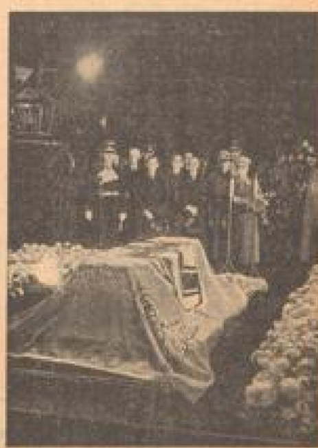
Auf deutschem Boden Am Aufbruchstage auf der französischen Front mit dem Heide in Baden etc. Unter Bild wurde in der Berliner Photographie aufgenommen. (Schäfer-Photopapier, Sonder-Photopapier-R.)