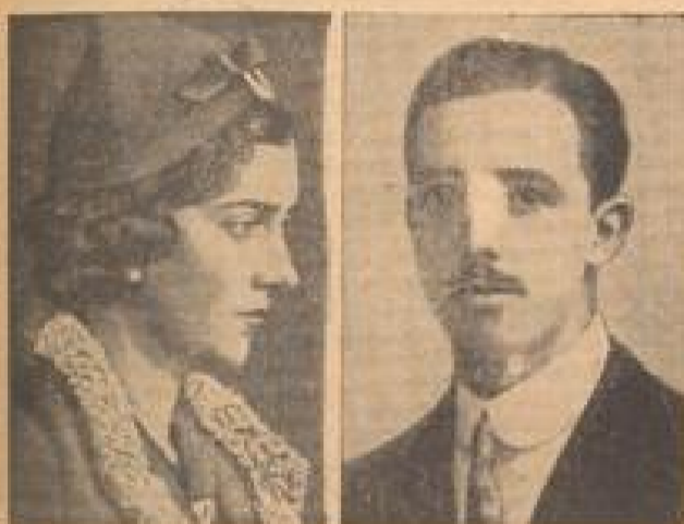
Verlobung im italienischen Königshaus In Rom wurde die Verlobung der Königin von Italien mit dem spanischen Prinzen Alfonso von Bourbon-Parma bekannt.