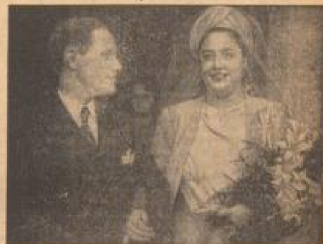
Napoleon III. heiratete in London In London wurde die Kaiserin Elisabeth mit dem russischen Kaiser Nikolaus II. verheiratet. Die Hochzeit wurde in der Berliner Photographie aufgenommen. (Schäfer, Sonder-Photopapier-R.)