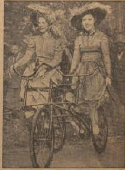
Mit vereinten Kräften ohne Pferdekräfte durch Neuport Hier ist das alte Mittel für zwei Personen, welches sich bei einer Notlage als sehr nützlich erweist. (Schäfer, Sonder-Photopapier-R.)