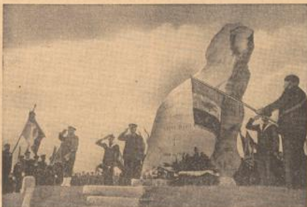
Denkmal für die französische Marine-Infanterie Bei „Mestre de Vieux“ in Nordfrankreich wurde dieser Gedenkstein für die im Weltkrieg gefallenen Kriegsmänner der Marine-Infanterie gesetzt.