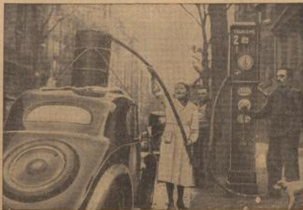
Im Zeichen der französischen Notverordnungen „Der hat, der hat“ hat die französische Notverordnung, die im Hinblick auf die Lebensmittelversorgung in Kraft ist. (Schäfer, Sonder-Photopapier-R.)