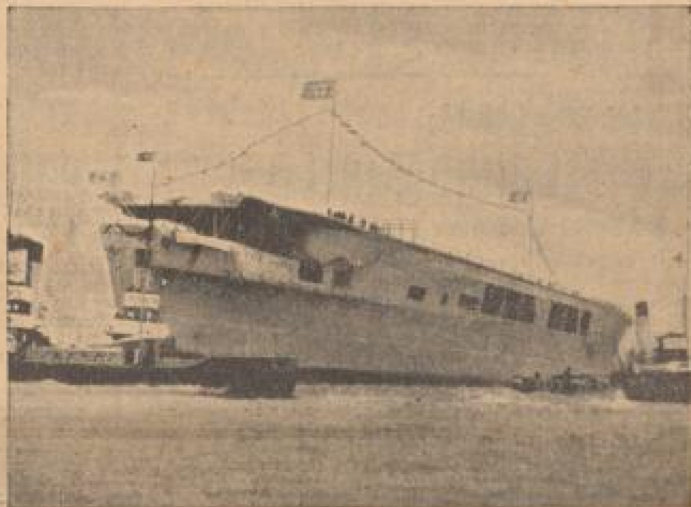
Der erste deutsche Flugzeugträger gleitet in sein Element