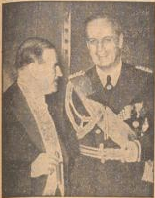
Reichsinnenminister von Ribbentrop und Ministerpräsident Papadowitz in der Wandelhalle der deutschen Botschaft in Paris.