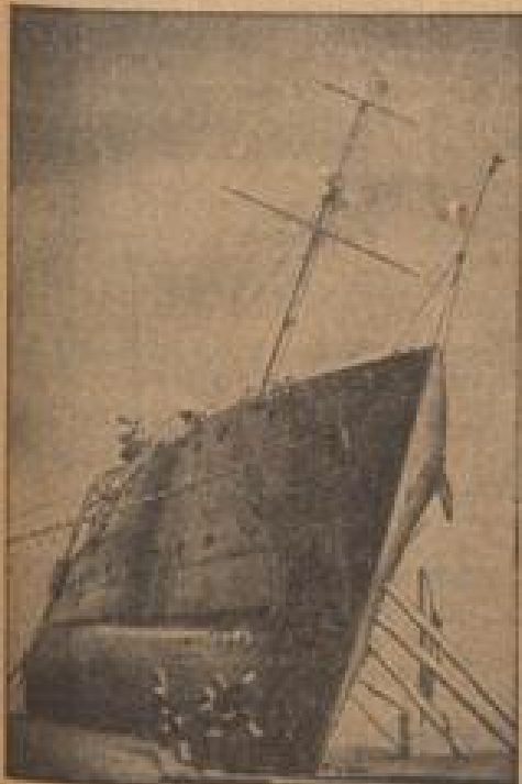
Japanisches Kanonenboot von Japanern auf Grund gejagt. Die Kanonenbooten der japanischen Flotte sind auf Grund und Ufer.