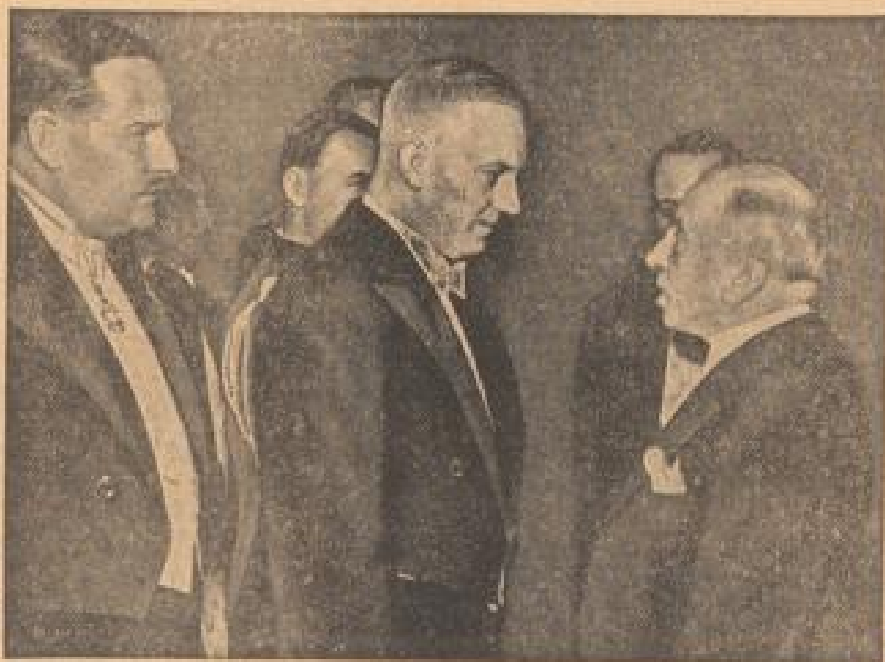
Die Diplomaten beim neuen tschecho-slawischen Staatspräsidenten. Der neue tschecho-slawische Staatspräsident Dr. Baha empfing die in Prag anwesenden Diplomaten der auswärtigen Mächte. Dr. Baha ganz rechts.