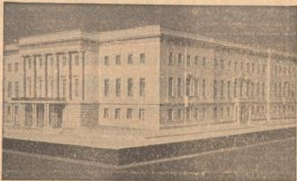
Die neue italienische Botschaft in Berlin. Das Model des geplanten Neubaus der italienischen Botschaft, das unter den von Generalantiquar für die Reichshauptstadt ausgearbeiteten Plänen auf der Societa Strada Deutschen Architektur- und Kunstgewerkschaftsausstellung in München gezeigt wird.