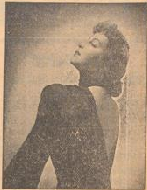
Ein schöner Rücken... Zorinka Bied, die beliebte Filmschauspielerin. (Lodig, Sonder-B.)