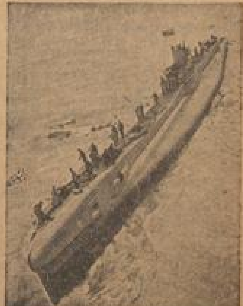
Englands neuester Motorboot-Bau tief vom Stapel. Im Virelverlag (Wien) ist jetzt der neueste Motorboot-Bau der britischen Kriegsmarine, ein 1000-Tonner, vom Stapel.