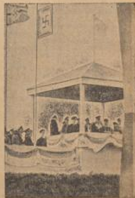
Der Führer und Generalleutnant Göring auf der Tafel