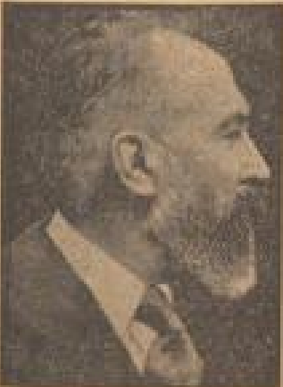
Der frühere französische Innenminister Dormoy ist als Zeuge in dem Plewitzkaja-Prozeß. Die jüngsten Mitteilungen zeigen, warum er der Tat mit Hilfe seiner eigenen Aussagen zu verurteilen.