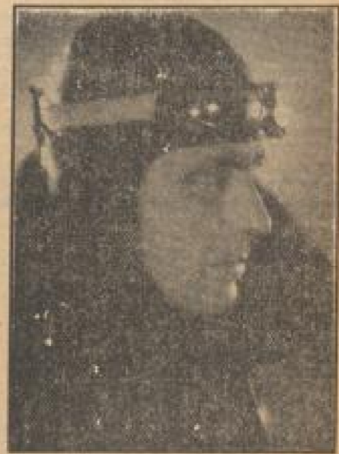
Karl Ludwig Diehl als Rennfahrer im Pallas-Film der Europa „Der stählerne Strahl“