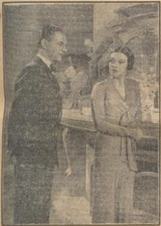
Atilla Hörbiger und Sybille Schmitz im R.N.-Film der Ufa „Pünktlich kommt aus Amerika“