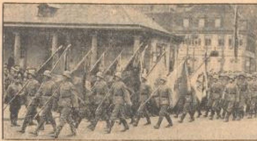
Die Reichswehrabordnung mit den alten Fahnen