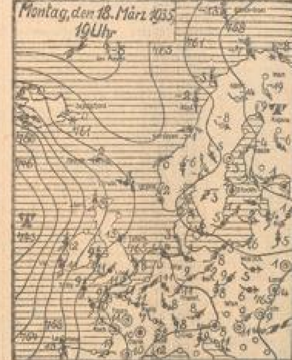
Wetterkarte der Frankfurter Univers. Wetterkarte